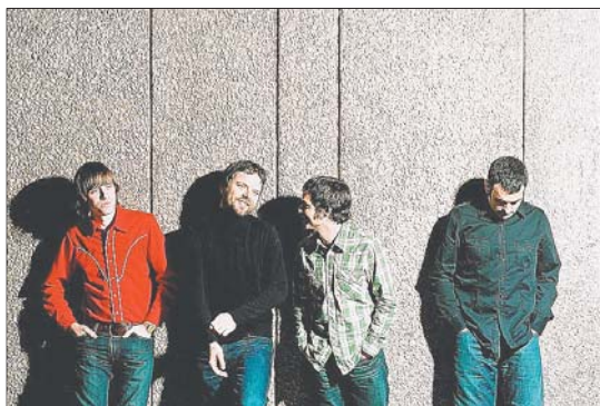
► Imagen de archivo del grupo La Habitación Roja, que regresará a la ciudad el 29 de marzo, en la Sala Zero.