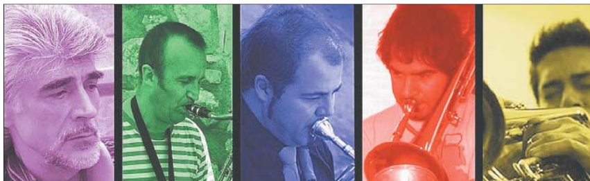
► El grupo de músicos que forman la banda Stromboli Jazz Blad, que actuará esta noche.

significativamente el número de espectadores. El apoyo por parte del público ha impulsado a los programadores de la sala a buscar nuevas fechas. Así, el martes 14 a las 21.00 horas se podrá ver de nuevo La Marató de Nova York , y Bildelberg Club Cabaret , el viernes 17 a las 21.00 horas y el sábado 18 a las 18.30 y 21.00 horas.