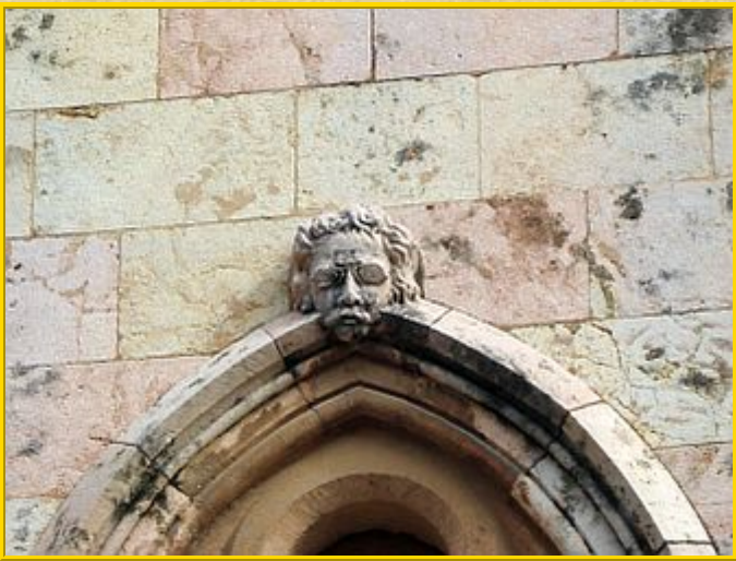
En la Casa de los Canónigos