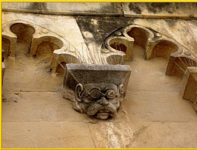
En la entrada del Claustro