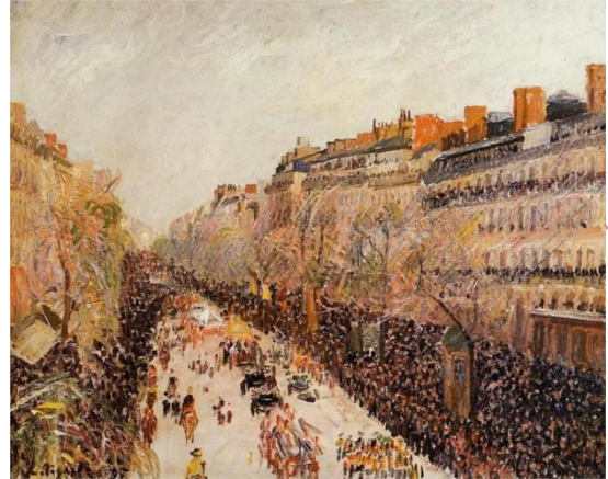
Imatge 4. Camille Pissarro Boulevard de Montmartre, dimarts gras 1897 Oli sobre llenç