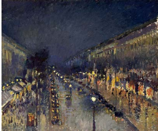
Imatge 3. Camille Pissarro Boulevard de Montmartre, efecte de nit 1897 Oli sobre llenç, 53.5 x 65 cm