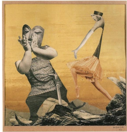
Imatge 4. Hanna Höch "Aliment per al pensament" 1946