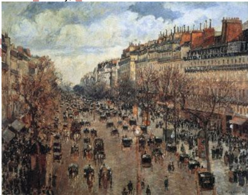
Imatge 1. Camille Pissarro Boulevard de Montmartre al capvepre, 1897 Oli sobre llenç,