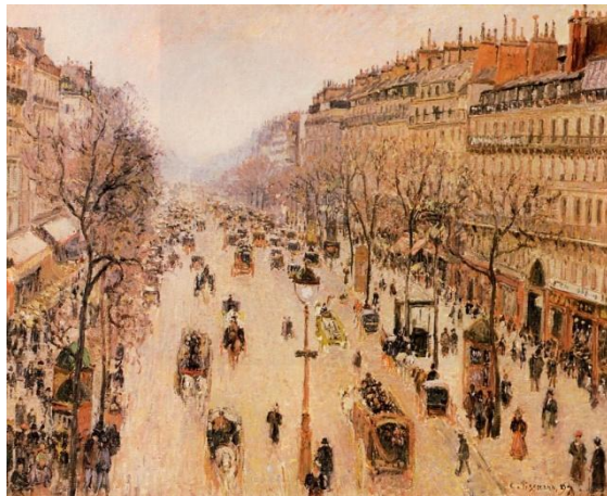
Imatge 5. Camille Pissarro Boulevard de Montmartre, matí 1897 Oli sobre llenç,