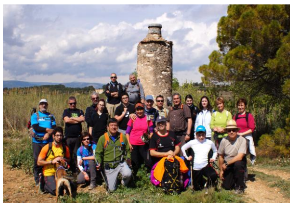
Respirall núm. 23 Bogatell

Vora el torrent del Bogatell ens retrobem amb la conducció de la Mina i ens fem una foto de grup davant del respirall núm.23. Fem un curt rodeig per creuar el Bogatell, deixem a mà dreta les quatre parets que resten del Mas Vell i fem cap al camí dels Morts de Vallmoll. Seguim l'asfalta't direcció Bellavista i albirem a mà esquerra el respirall núm.12 que sobresurt quasi engolit per la brolla del barranc de l'Alt del Cosidor, però el pont de pedra que el sustenta ja no es veu des del nostre camí.