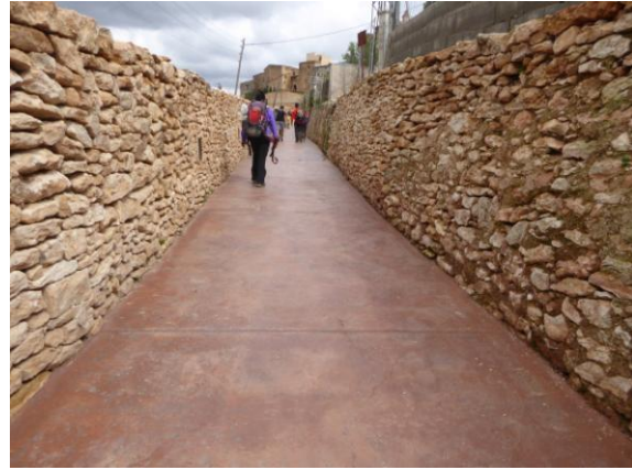
Camí dels Retorts

Creuem la TV-2034, passem a frec de la masia del Trull i finalment prenem el restaurat camí dels Retorts, que ens condueix fins el Pi de Puigpelat i fins el Portal del poble mentre el rellotge del cloquer de l'església assenyala les tres de la tarda.