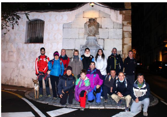
Font de l'Arquebisbe

Descripció: A les sis del matí, els participants acudim al Portal de Sant Antoni de Tarragona, l'amic Joan Aubia ens fa la foto de grup com tots els anys i a les 6h.10m. iniciem l'excursió, passant primer pel casc antic i eixint del mateix pel Portal del Roser. Pel Camp de Mart arribem a l'Encanyada mentre encara és negra nit. Passem sota el pont de la via de circumval·lació de la ciutat i per les Fonts Noves i Velles de l'Oliva. També ens atansem a contemplar les restes de l'Aqüeducte Romà, que afloren prop del respirall núm. 58, l'últim de la Mina i el primer que trobem en el nostre recorregut.