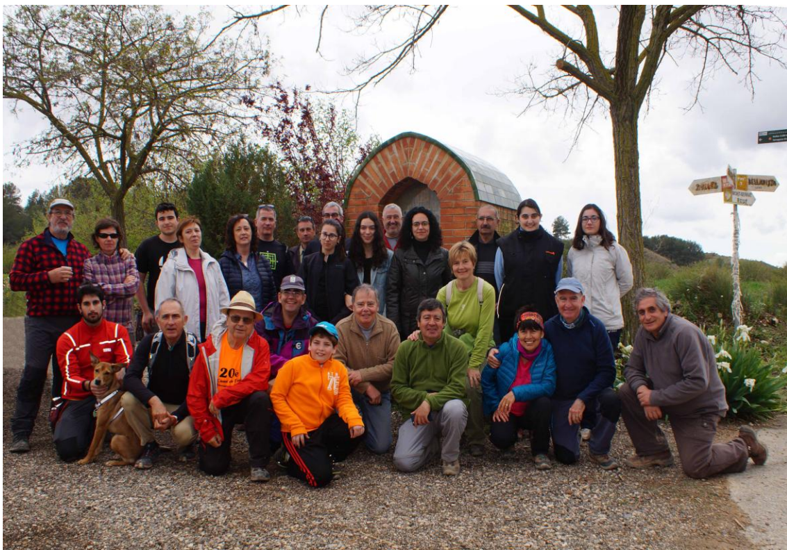
A la Capella

Creuem la TV-2034, passem a frec de la masia del Trull i finalment prenem el restaurat camí dels Retorts, que ens condueix fins el Pi de Puigpelat i fins el Portal del poble mentre el rellotge del cloquer de l'església assenyala les tres de la tarda.