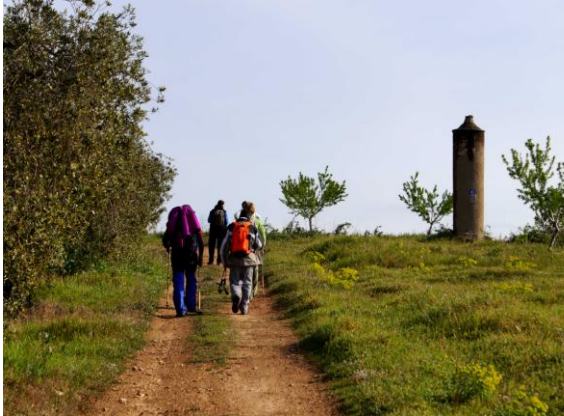
Respirall núm. 47 Pallaresos

Mitja hora més tard, reprenem la caminada, creuem els Pallaresos i ens dirigim cap el coll de Tapioles i cap el bosc del Ferrer Xic. Arribem al bar del Casal de la Secuita a les deu i deu del matí. Fem un café junt amb els amics que s'incorporen a la marxa i continuem trescant entre vinyes, farratges i garrofers. Els respiralls núm. 37,36,35,34,33 i 32 es van succeint. Després ens allunyem una estona del trajecte de la Mina tot prenent el camí de la pallissa del Dalmau i de les rodalies de la finca del Pontarró.