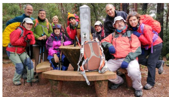
Taula dels Quatre Batlles

carbonera reconstruïda, el gran pou de gel, la casa forestal de la Pena i la font del Deport. Hem hagut de treure les capelines però la pluja que s'insinua no es consolida. Al mirador de la Pena s'acaba la pujada i arribem a les pistes, al coll de la Creu de l'Ardit i al coll de la Mola, on passades les onze del matí ens aturem a fer un mos. La humitat i el vent fred ens fan continuar de seguida. Aquí deixem el GR171.4 per una resta de sender, en realitat és l'antic camí, que puja una mica i enfila directe la carena fins el Clot del Llop, on trobem el GR171. Ara tot és pista plana, passem per la Taula dels Quatre Batlles fins la Mola d'Estat o dels Quatre Termes, on podem albirar en paisatge entre núvols que sembla que es van obrint. En direcció oest passen els successius colls de