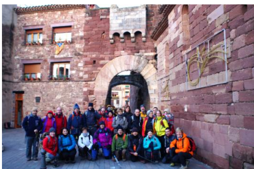
Sortim de Prades

Diumenge a dos quarts de nou sortim de Prades per la Creu de Montblanc i el camí ramader a Poblet que ha estat recuperat i senyalitzat convenientment. El termòmetre assenyala 3°C però la pujada sostinguda per pista ens fa entrar en calor. La Roca del Grínjol o Gringol, una agulla aïllada entre bosc, és el lloc triat enguany per col·locar el nostre 36è pessebre. Des de dalt d'una roca propera