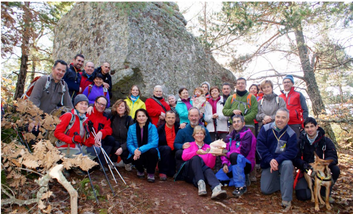
36è pessebre a la Roca del Grínjol

Serra Alta en baixada constant pel vessant nord del massís. Hi ha una sèrie d'indrets senyalitzats, con una pedrera de pedra d'esmolar o diferents places carboneres. La baixada s'accentua una estona però acaba poc abans del pont de Torners ja a plana de la Conca de Barberà. La carrerada passa a prop del castell de Riudabella i així arribem al monestir de Poblet a les dues de la tarda.