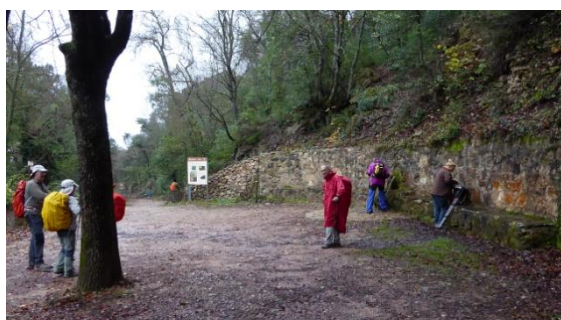
Font del Deport

Amb un temps insegur i plujós, a 10°C de temperatura, encetem dissabte la caminada prenent el GR171.4 que surt del monestir, cap a les Masíes per carretera i entra al barranc de San Bernat, remuntant-lo sense pausa pel magnífic bosc protegit. El sender és ample i fressat, passa al costat d'una