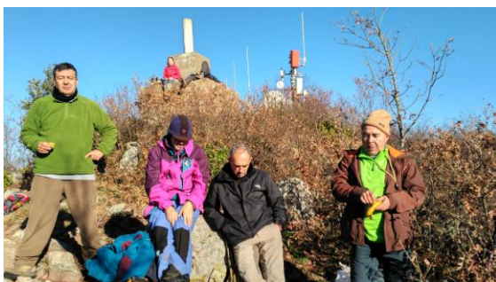
Tossal de la Baltasana

la Cova Fumada, la Caldereta i Coster d'en Perroi. Trobem de cara uns motoristes per l'estret sender que teòricament tenen prohibit. A partir del coll de la Nevera entrem a la zona de pistes dels Plans del Pagès, agafem aigua a la font que raja per la pluja dels darrers dies i fem la darrera pujada al cim del Tossal de la Baltasana, a 1.202m. El cel s'ha obert i gaudim del sol de tardor mentre dinem. La baixada fins a Prades és directa i plaent, són les quatre de la tarda quan entrem a la plaça. Tenim previst sopar i dormir a la vila vermella.