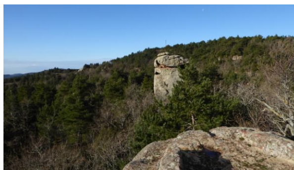
Roca del Grínjol

podem guaitar pel damunt del bosc fins els cims del Pirineu nevat. Travessem un tram del camí d'ahir i seguim les indicacions que ens porten pel lloc de la