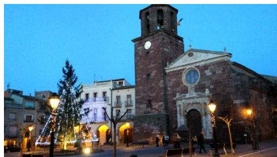
Plaça Major de Prades

Diumenge a dos quarts de nou sortim de Prades per la Creu de Montblanc i el camí ramader a Poblet que ha estat recuperat i senyalitzat convenientment. El termòmetre assenyala 3°C però la pujada sostinguda per pista ens fa entrar en calor. La Roca del Grínjol o Gringol, una agulla aïllada entre bosc, és el lloc triat enguany per col·locar el nostre 36è pessebre. Des de dalt d'una roca propera