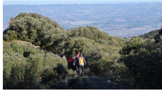
Camí ramader per la Serra Alta

Serra Alta en baixada constant pel vessant nord del massís. Hi ha una sèrie d'indrets senyalitzats, con una pedrera de pedra d'esmolar o diferents places carboneres. La baixada s'accentua una estona però acaba poc abans del pont de Torners ja a plana de la Conca de Barberà. La carrerada passa a prop del castell de Riudabella i així arribem al monestir de Poblet a les dues de la tarda.