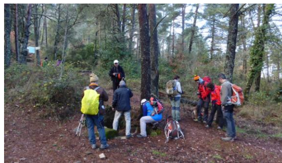
Font del Mas d'en Pagès

la Cova Fumada, la Caldereta i Coster d'en Perroi. Trobem de cara uns motoristes per l'estret sender que teòricament tenen prohibit. A partir del coll de la Nevera entrem a la zona de pistes dels Plans del Pagès, agafem aigua a la font que raja per la pluja dels darrers dies i fem la darrera pujada al cim del Tossal de la Baltasana, a 1.202m. El cel s'ha obert i gaudim del sol de tardor mentre dinem. La baixada fins a Prades és directa i plaent, són les quatre de la tarda quan entrem a la plaça. Tenim previst sopar i dormir a la vila vermella.