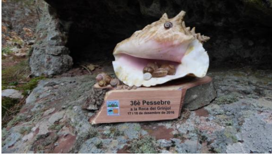
El 36è pessebre o dels cargols