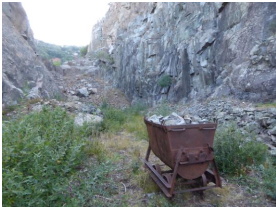
Filó de Granit a cel obert

Seguim pujant per la pista forestal cap al Sud, aproximadament un quilòmetre més amunt trobem el pal indicador del trencall de les antigues pedreres de granit, creuem el torrent i pugem fins la placeta on treballaven els picapedres, prop del filó a cel obert d'on extreien el mineral.