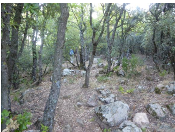
Bosc Carena de Baselles

Superat aquest atlètic desnivell assolim el collet del Roc i un corriolet ens porta en dos minuts pel fil de l'aresta fins la creu de ferro del Roc de Ponent. Retornem al collet i seguim guanyant alçada superant la Carena (1.018m.) i el coll de Baselles, el sender discorre pel mig d'un ufanós bosc d'alzines i rebolls amb amples clarianes i amb vistes fins al Pirineu.