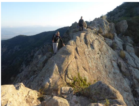
Sender pel fil de l'aresta

Tot seguit continuem ascendint pel sinuós corriol que ens aboca a la estreta i llarga tartera de grans blocs granítics, que es despenja directe del vessant S.E. del Roc de Ponent.