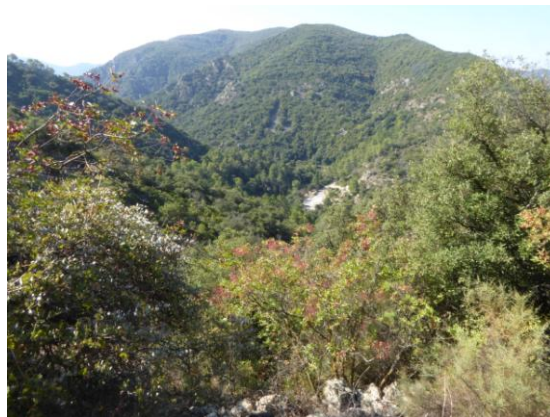
Al mig Àrea de Lleure de la Roca de l'Abella