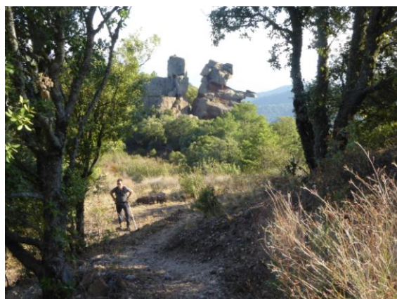
Els Frares Encantats

Ja de baixada passem vora l'espectacular filó "Atrevida", del que s'extreia la barita o sulfat de bari un mineral pesant i blanquinós. El descens és llarg però còmode, creuem la Serra de l'Arena i albirem els Frares Encantats, uns singulars conglomerats fracturats i erosionats de forma capritxosa pels agents meteorològics.