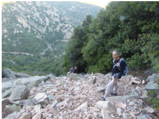
La llarga Tartera