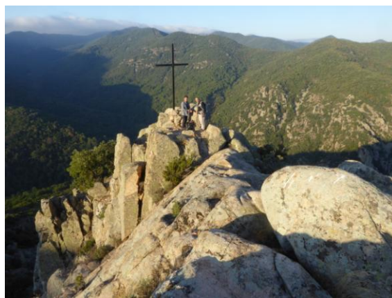
Cim del Roc de Ponent

Superat aquest atlètic desnivell assolim el collet del Roc i un corriolet ens porta en dos minuts pel fil de l'aresta fins la creu de ferro del Roc de Ponent. Retornem al collet i seguim guanyant alçada superant la Carena (1.018m.) i el coll de Baselles, el sender discorre pel mig d'un ufanós bosc d'alzines i rebolls amb amples clarianes i amb vistes fins al Pirineu.