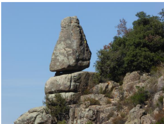
Roca de l'Abella

Itinerari: Sortim de casa, anem cap a Espluga, després a Poblet i ens arribem fins l'Àrea de lleure de la Roca de l'Abella (560m.), situada al Barranc de Castellfollit, uns quatre-cents metres més amunt de la creu de terme bastida a frec de la carretera TV-7003 de Poblet a Prades, just al començament de la pista forestal de Castellfollit. Deixem el vehicle a l'aparcament, ens calcem les botes i iniciem aquest itinerari pedestre de mitjana dificultat, tan ben buscat, treballat, senyalitzat i publicat amb el núm. 5 dels opuscles editats pel Centre de Gestió i Informació del PNIN (Paratge Natural d'Interès Nacional) de Poblet.