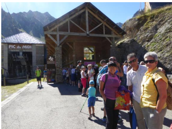
Estació de la Mongie-Midi

Dimecres dia 24: A primera hora recollim els estris, pleguem les tendes i embrenem el viatge d'aproximació al complex científic del Pic du Midi, cim de 2.877m.a. que domina la regió de La Bigorre. Retornem a Luz-St.-Sauveur i prenem la carretera del N.E.. En poc més d'una hora superem el coll del Tourmalet de 2.115m.a., baixem fins l'estació d'esquí de la Mongie situada a 1.800m.a.. Deixem el cotxe al aparcament de l'estació i prenem el telefèric, que tot i fent un transbord en el pic Taulet a 2.342m.a., en quinze minuts ens deixa al cim del Midi, també conegut pels francesos com la muntanya que abraça al cel.