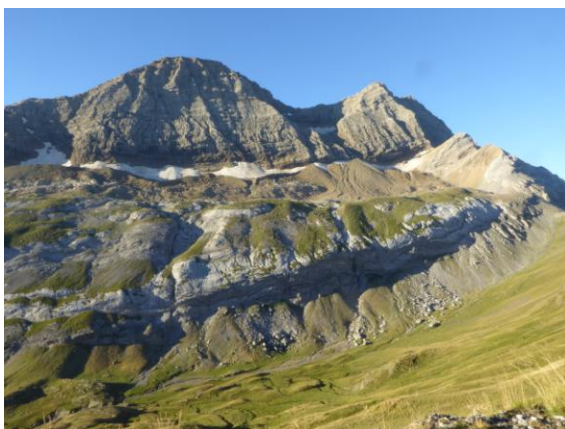
Port Bujaruelo Taillón

Itinerari: Dilluns dia 22: sortim de Tarragona a quarts d'onze del matí, anem cap a Lleida, Viella, entrem en territori francès i poc després ens deturem vora el riu Garona per dinar de picnic. Després cerquem l'Autopista del Sud de França i anem de Montrejeau a Tarbes, on la deixem i continuem cap a Lourdes, Argelès-Gazos, Luz-St.-Sauveur, Gèdre i Gavarnie. Plantem les tendes i ens instal·lem al càmping Pa de Sucre.