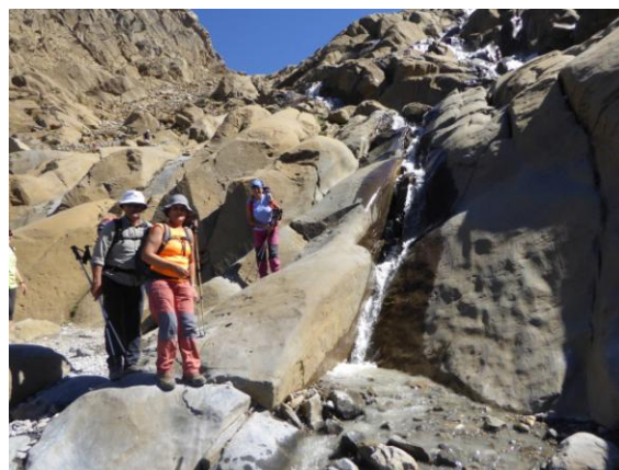
Barranc del Glaciar del Taillón

Dimarts dia 23: A les 7h. anem amb cotxe a Gavarnie, prenem la carretera d'accés a les pistes d'esquí i continuem fins l'aparcament del Col de Tentes, situat a 2.208m.a. Deixem el vehicle i pels vols de les 8h. iniciem l'ascensió, seguim el kilòmetre i mig del traçat de la vella carretera fins el Port de Bujaruelo 2.272m.a.