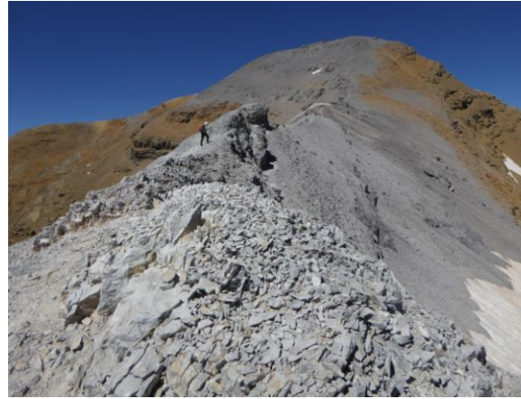
Carena del Taillón

A l'altre vesant del coll destaca una gran grua a frec del refugi de Serradets vora una gran zona reservada per les obres d'ampliació. Sortegem els obstacles i ens dirigim cap a la gegantina bretxa de Roland que té prop d'un centenar de metres d'alçada i quaranta d'amplada. Superada la portalada arribem als 2.807 m.a..