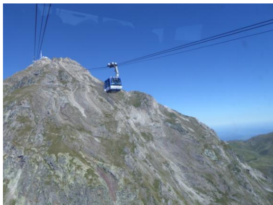
Pic de Midi

Aquest complex va ser construït l'any 1880, i s'ha anat ampliant i reformant fins l'any 1960, compte amb diverses estacions amb cúpules, telescopis i altres instruments per l'estudi i observació del Sol, la Lluna i tota la nostra galàxia, l'any 1963 la NASA hi va realitzar la cartografia de la Lluna per les missions Apol·lo.