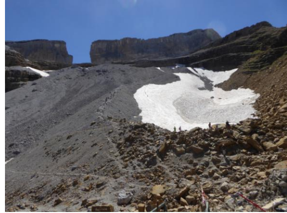
Bretxa de Roland

A partir del Port continuem cap a l'Est seguint el sender que recorre la base de la impressionant cara Nord del Taillón fins arribar al torrent per on baixen les aigües provinents del desglaç de les seves altes congestes. Aleshores la traça s'orienta cap el S.E. i s'enfila tot cercant el millor pas lliscant entre pol·lides graonades fins arribar al coll de Serradets situat a 2.587m.a..