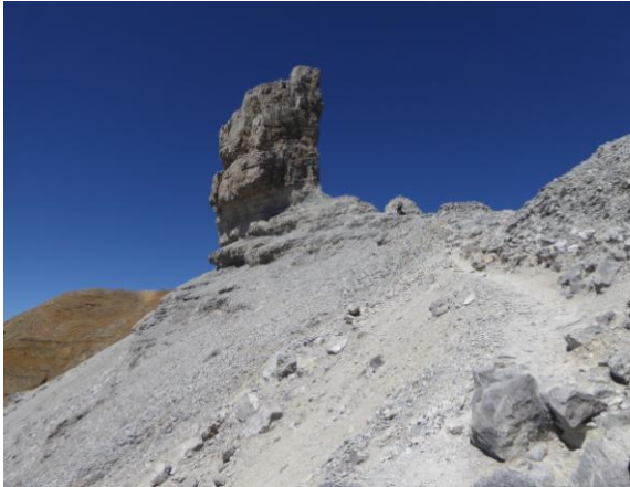
El dit i Falsa Bretxa

A partir del Port continuem cap a l'Est seguint el sender que recorre la base de la impressionant cara Nord del Taillón fins arribar al torrent per on baixen les aigües provinents del desglaç de les seves altes congestes. Aleshores la traça s'orienta cap el S.E. i s'enfila tot cercant el millor pas lliscant entre pol·lides graonades fins arribar al coll de Serradets situat a 2.587m.a..