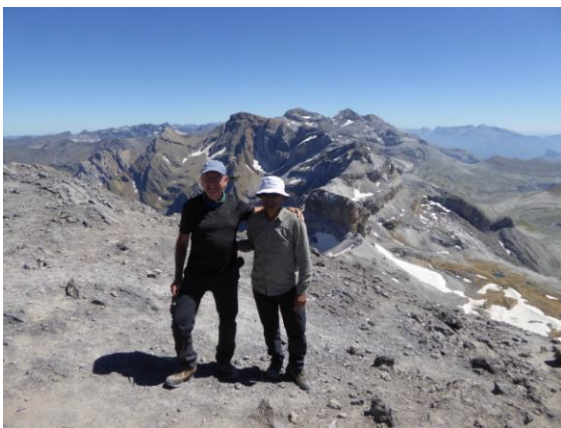
Cim i Perdut al fons

A l'altre vesant del coll destaca una gran grua a frec del refugi de Serradets vora una gran zona reservada per les obres d'ampliació. Sortegem els obstacles i ens dirigim cap a la gegantina bretxa de Roland que té prop d'un centenar de metres d'alçada i quaranta d'amplada. Superada la portalada arribem als 2.807 m.a..