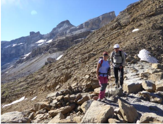
Coll de Serradets