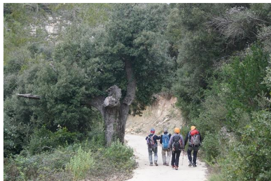
Alzina de l'Escoda

Comencem a caminar quan són les nou en punt del matí en direcció al Coll del Guix, i quan hi arribem continuem caminant per la Vall de Massanes. De mica en mica anem deixant el camí que puja a Llaberia pels Revolts a mà esquerra, la bassa de Massanes i l'Alzina de l'Escoda també a mà esquerra.