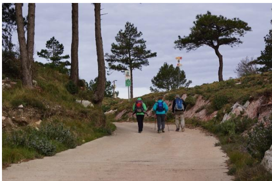
Arribant al coll del Guix

Fa un temps vam fer un tomb a la Mola de Colldejou a peu de paret, l'he anomenat "primer nivell". Avui hem fet un altre tomb a la Mola però més ampli, l'anomeno "segon nivell", i transcorre sempre entre els 400 i els 650 metres d'alçada. El punt de sortida és, si fa no fa, a mig camí entre Colldejou i el Coll del Guix.