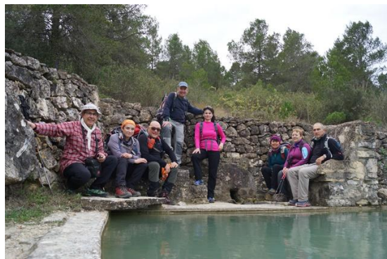
Font de Fontesaubelles