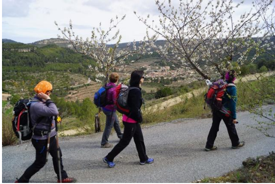
Camí vell de Colldejou

A la font podem a menjar una mica i després continuem en direcció al Pla de la Femada, i just quan el superem trobem la cruïlla del camí que portem i la pista del Camí Vell de Colldejou, la qual agafem cap a la dreta, i que ens porta per una pista d'asfalt i de ciment fins la carretera T-322, que va de la Torre de Fontaubella fins a Colldejou, just per on creua el camí que puja a la Mola per la Canal del Mig.