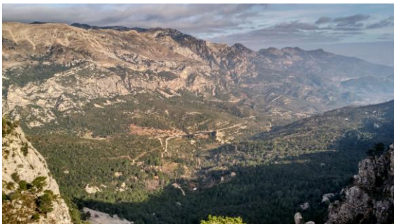
Vall del Toscar

El Toscar és un paratge ombrívol i amb aigua abundant a qual s'arriba des de Tortosa agafant la carretera d'Alfara de Carles fins la desviació senyalitzada. Estem dintre el parc natural. Deixem el cotxe a l'aparcament de l'ermita de Santa Magdalena al costat dels Xorros. Prenem el GR171 que puja en direcció sud, la pujada és lenta per un sender ample i fressat però humit i rrelliscós alhora, entre bosc de pins i una espessa boixeda. Arribem a una colladeta des d'on tenim una magnífica panoràmica de la vall del Toscar, el castell de Carles,