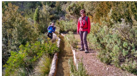
Bassis de la Solana

el poble d'Alfara a la llunyania i més amunt, el pic Espina i les rases del Maraco. Passem a un barranc secundari i més endavant un altre coll senyalitzat ens obre la porta de la Vallfiguera. Esmorzem al sol i admirem les altes parets i el grans desnivells que caracteritzen aquets massís. Més endavant trobem els Bassis de la Solana a un minut del camí, estan fets de pedra i plens d'aigua.