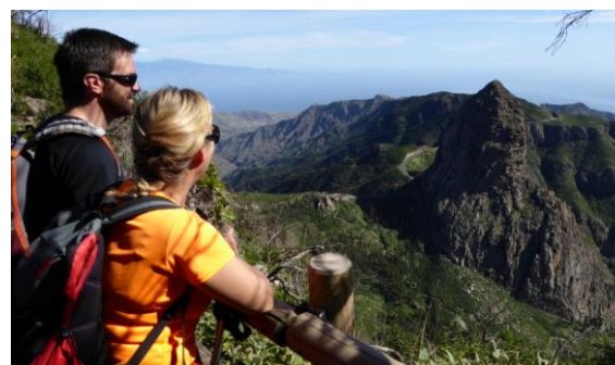
Mirador del Roque de Agando

Més detalls a: http://ca.wikiloc.com/wikiloc/view.do?id=12002612 . Si voleu més informació sobre senders a la Gomera: http://www.biosferalagomera.com/