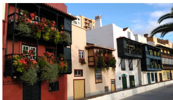
Santa Cruz de la Palma

A la web www.senderosdelapalma.com diu que hi ha mil km de senders i deu ser veritat, nosaltres hi vam fer quatre excursions i tot estava molt ben senyalitzat, l'illa està declarada Reserva de la Biosfera per la Unesco. El dia 9 vam esmorzar al sol a Santa Cruz, la capital, i quan vam arribar al lloc on volíem caminar, sota el mar de núvols, queia una pluja consistent i empenyadora. De nou amb al cotxe vam anar a veure el centre de visitants del parc nacional de la Caldera de Taburiente, formació volcànica al centre de l'illa.