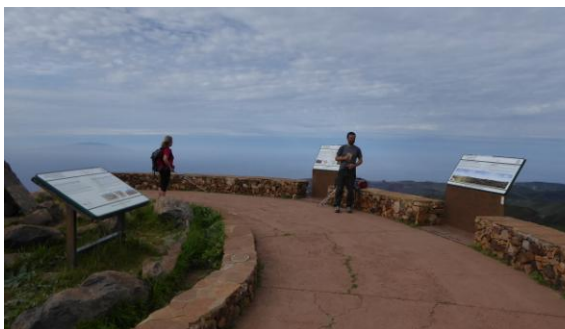
Alto de Garajonay

El divendres 15 fem el recorregut 14 pel parc nacional de Garajonay, concretament la zona sud que va ser devastada per un incendi l'any 2012. A diferència del pinar canari, aclimatat al foc, el bosc de laurisilva és un fòssil vivent i no es regenera fàcilment. Des de Laguna Grande pugem al punt més alt de l'illa, el Alto de Garajonay, de 1.487 metres d'alçada, lloc sagrat dels primitius gomers. Detalls: http://ca.wikiloc.com/wikiloc/view.do?id=12002545