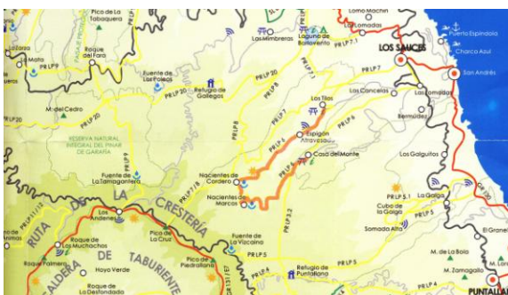
Itinerari Marcos y Cordero

El dia 11 vam entrar de ple al vessant nord, a la població de Los Sauces, amb bon temps assegurat. Prop del centre de visitants Los Tilos, un taxi-furgoneta ens va estalviar mil metres de desnivell fins la Casa del Monte, on prenem el PR-LP6 que segueix un canal que porta l'aigua dels Nacientes de Marcos y Cordero. Excavat en el pendent escarpat del barranc, el canal i el sender