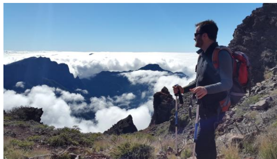
El mar de núvols

El dia 11 vam entrar de ple al vessant nord, a la població de Los Sauces, amb bon temps assegurat. Prop del centre de visitants Los Tilos, un taxi-furgoneta ens va estalviar mil metres de desnivell fins la Casa del Monte, on prenem el PR-LP6 que segueix un canal que porta l'aigua dels Nacientes de Marcos y Cordero. Excavat en el pendent escarpat del barranc, el canal i el sender