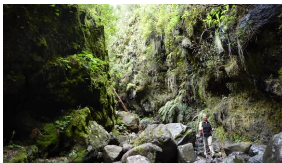
Barranc de baixada

fulles lanceolades, especialitzat el atrapar les gotes d'aigua de la boira creada pel mar de núvols. Les falgueres són monumentals. Vam fer més de 6 hores.