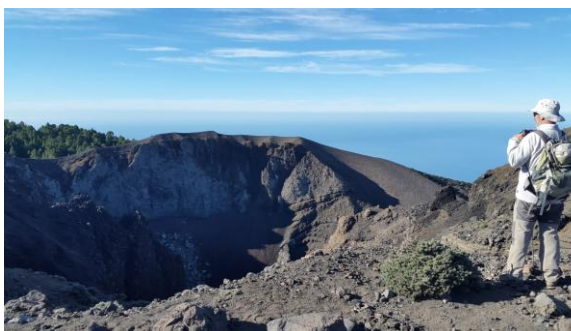
Volcán Hoyo Negro

seguida les panoràmiques són amples i enlluernadores: enrere guaitem tot el conjunt de la Caldera de Taburiente i el sol ixent il·luminant la zona poblada de los Llanos de Aridane. Diversos encreuaments faciliten la connexió amb senders que puguen des de la costa. Un darrere l'altre, passem pel costat de diversos cràters travessant un terreny aspre i desolat, de coloracions minerals d'un cromatisme punyent. A gairebé dos mil metres d'alçada passem pel punt