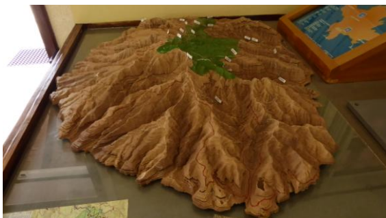
Maqueta de la Gomera

torturada amb barrancs fonsos i insalvables. No és tan alta com la Palma i el parc nacional ocupa el centre geomètric on creix la laurisilva. Cap a migdia