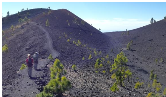
Ruta dels volcans

més elevat de l'itinerari, amb una panoràmica superba d'un dia radiant de sol: les illes de Tenerife, la Gomera i el Hierro són perfectament visibles a l'horitzó, els poblets de la costa semblen miniatures des de tan amunt. Una llarga baixada ens porta al poble de Fuencaliente, on un taxi ens retorna al punt de sortida. Detalls: http://ca.wikiloc.com/wikiloc/view.do?id=12002464 . El dia 13 volem a la Gomera i el 14 veiem el centre de visitants del parc nacional de Garajonay, patrimoni mundial. La Gomera és una illa casi rodona de geografia