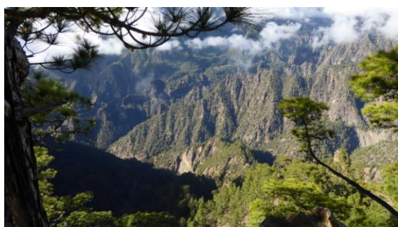
Interior de la caldera

A la web www.senderosdelapalma.com diu que hi ha mil km de senders i deu ser veritat, nosaltres hi vam fer quatre excursions i tot estava molt ben senyalitzat, l'illa està declarada Reserva de la Biosfera per la Unesco. El dia 9 vam esmorzar al sol a Santa Cruz, la capital, i quan vam arribar al lloc on volíem caminar, sota el mar de núvols, queia una pluja consistent i empenyadora. De nou amb al cotxe vam anar a veure el centre de visitants del parc nacional de la Caldera de Taburiente, formació volcànica al centre de l'illa.