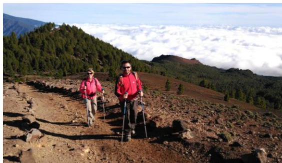
Pel damunt del mar de núvols

seguida les panoràmiques són amples i enlluernadores: enrere guaitem tot el conjunt de la Caldera de Taburiente i el sol ixent il·luminant la zona poblada de los Llanos de Aridane. Diversos encreuaments faciliten la connexió amb senders que puguen des de la costa. Un darrere l'altre, passem pel costat de diversos cràters travessant un terreny aspre i desolat, de coloracions minerals d'un cromatisme punyent. A gairebé dos mil metres d'alçada passem pel punt