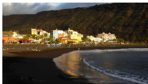
Platja de Tazacorte

Per aprofitar la resta del dia vam decidir fer una passejada des de La Cumbrecita, pàrquing-mirador a la vora sud de la caldera volcànica, recorrent un parell de miradors més i podent gaudir de la fondalada de colors minerals i recoberta de una espessa pineda de pi canari que la boira intentava tapar. Hores, km i més detalls a: http://ca.wikiloc.com/wikiloc/view.do?id=12002402