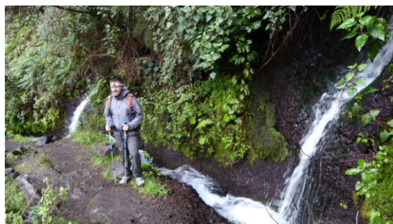
Nacientes de Marcos

paral·lel travessen una dotzena de túnels (a l'últim hi plou) aigües amunt, fins els naixements. Després queda la llarga baixada per un terreny boscos de laurisilva, bosc primigeni que a l'era terciària ocupava tot el sud d'Europa. Està format per una vintena d'espècies semblants al llorer, de caràcter perennifoli i