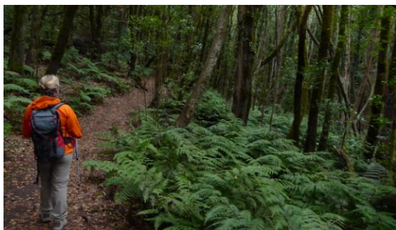
Laurisilva del Cedro

La millor excursió per la Gomera va ser la darrera: el barranc del Cedro, santuari del bosc de laurisilva més ben conservat de l'arxipèlag. Des del Caserío del Cedro pugem pel fons d'un barranc amb aigua, un bosc atapeït i ombrívol, on la falta de grans animals dóna una forta sensació de silenci. A dalt, una sèrie de miradors permeten admirar els famosos roques volcànics.