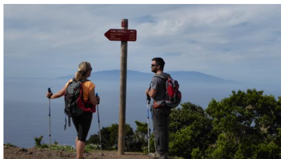
Illa de la Palma al fons

El divendres 15 fem el recorregut 14 pel parc nacional de Garajonay, concretament la zona sud que va ser devastada per un incendi l'any 2012. A diferència del pinar canari, aclimatat al foc, el bosc de laurisilva és un fòssil vivent i no es regenera fàcilment. Des de Laguna Grande pugem al punt més alt de l'illa, el Alto de Garajonay, de 1.487 metres d'alçada, lloc sagrat dels primitius gomers. Detalls: http://ca.wikiloc.com/wikiloc/view.do?id=12002545