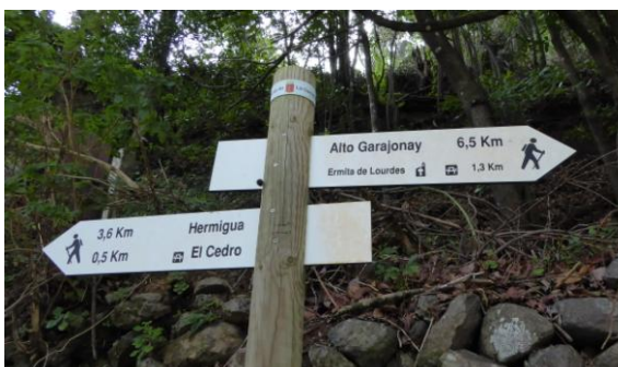
Senyalització del parc

La millor excursió per la Gomera va ser la darrera: el barranc del Cedro, santuari del bosc de laurisilva més ben conservat de l'arxipèlag. Des del Caserío del Cedro pugem pel fons d'un barranc amb aigua, un bosc atapeït i ombrívol, on la falta de grans animals dóna una forta sensació de silenci. A dalt, una sèrie de miradors permeten admirar els famosos roques volcànics.