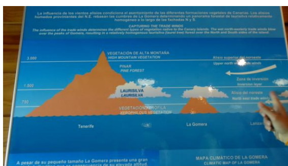
Influència del alisi

La Palma i la Gomera junt amb El Hierro són les illes occidentals de l'arxipèlag canari i les més afectades pel clima atlàntic, lluny de la influència continental africana com Lanzarote o Fuerteventura. Junt amb el seu origen volcànic, els vents alisis originats per l'anticicló de les Açores, hi defineixen el clima i el paisatge: carregats d'humitat, en trobar el relleu muntanyós, es veuen obligats a guanyar alçada i al refredar-se, es condensen, formant un mar de núvols característic que cobreix el cel del vessant nord de les illes la major part de l'any. Aquesta boira persistent és una mena de pluja horitzontal que fa créixer una fresca vegetació exuberant i estratificada segons l'alçada (bosc de laurisilva, monteverde); per contra, el vessant sud és més sec i calorós.