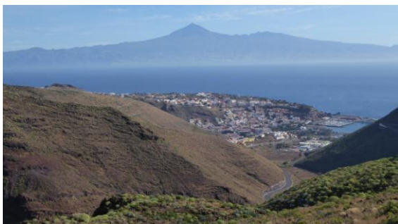
San Sebastián i Tenerife

més elevat de l'itinerari, amb una panoràmica superba d'un dia radiant de sol: les illes de Tenerife, la Gomera i el Hierro són perfectament visibles a l'horitzó, els poblets de la costa semblen miniatures des de tan amunt. Una llarga baixada ens porta al poble de Fuencaliente, on un taxi ens retorna al punt de sortida. Detalls: http://ca.wikiloc.com/wikiloc/view.do?id=12002464 . El dia 13 volem a la Gomera i el 14 veiem el centre de visitants del parc nacional de Garajonay, patrimoni mundial. La Gomera és una illa casi rodona de geografia