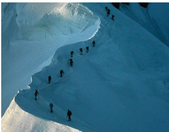
La perillosa aresta de les Bosses

Passat el refugi Vallot, l'aresta de les Bosses és el tram més tècnic i exigent.