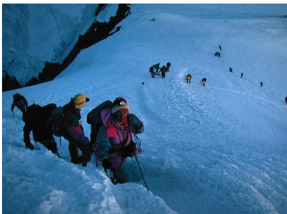
Primeres llums de la matinada

Les dues primeres hores es fan a la llum del frontal, seguint la traça marcada.