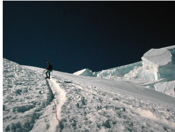
Cal anar encordats en tot moment

Passats el Grand i el Petit Plateau, la ruta voreja els perillosos seracs que es desprenen de l'Aiguille du Goûter. Les esquerdes sovintegen i cal saltar-les.