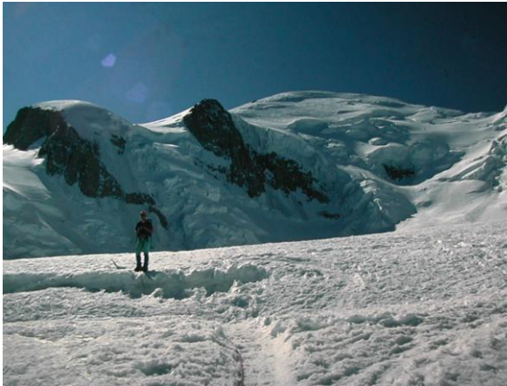
Gelera de Bossons i el cim al fons

Encarada a la vall, la gelera és una gran balconada de grans panoràmiques