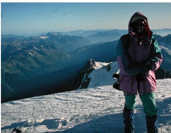
El premi del cim, a 4.808m

El cim del Mont Blanc en un dia clar és el millor premi a l'esforç de tantes hores