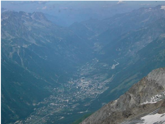
Chamonix, la capital alpina d'Europa

El Mont Blanc, amb 4.808m d'alçada sobre el nivell del mar, és la muntanya més alta de la serralada dels Alps i d'Europa occidental. És per tant, un dels objectius més cobejats pels alpinistes de tots els països.