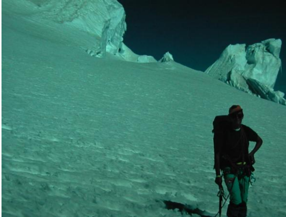
Baixada per la gelera de Bossons