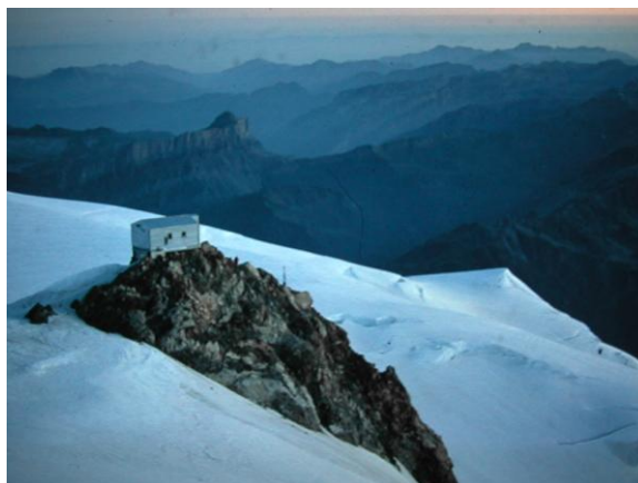
Refugi d'emergència Vallot

Les dues primeres hores es fan a la llum del frontal, seguint la traça marcada.