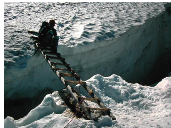
Travessant una esquerda

El telefèric del Pla de l'Aiguille és el darrer tràmit per baixar a la vall amb la sensació d'alegria per haver escalat un gran cim, el més gran dels Alps.