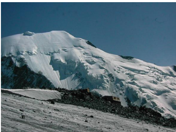
Refugi Tête Rouse i agulla Bionassay

L'aproximació al Mont Blanc parteix de la ciutat de Chamonix, situada a 1.035m d'alçada al fons de la vall del mateix nom, al cor de l'Alta Savoia francesa. El telefèric de Les Houches puja fins el replà de Belvedere, on un trenet de cremallera arriba fins el Nid d'Aigle, a 2.372m. Allí comença el sender costerut que serpenteja fins el pla i la cabana de Rognes. Apareixen les primeres congestes i la ruta passa al costat del refugi de la Tête Rouse, s'encara amb la travessa perillosa del Grand Couloir i grimpa per l'esperó rocallós de l'agulla de Goûter, deixant a mà dreta els pendents glaçats de l'Aiguille de Bionassay.