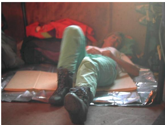
Qui puja sense reserva dorm a terra

per estendre la màrfega i passar la nit com es pot. Total, a les tres de la matinada ja se surt cap el cim, en plena nit i encordats a sobre la gelera.