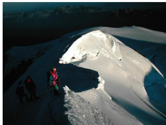
L'esmolada aresta de les Bosses

Passat el refugi Vallot, l'aresta de les Bosses és el tram més tècnic i exigent.