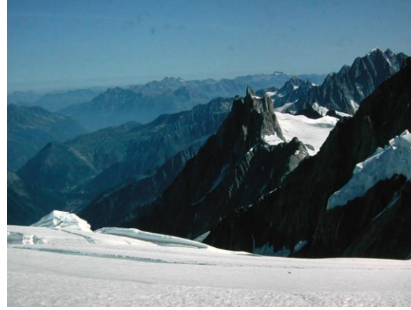
L'Aiguille du Midi

Encarada a la vall, la gelera és una gran balconada de grans panoràmiques