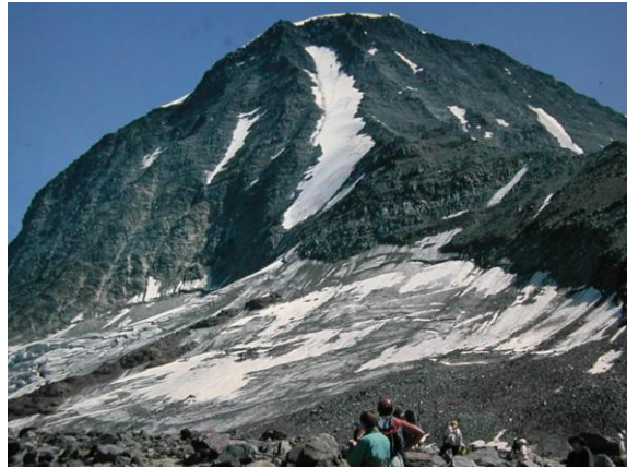
Pujant l'Aiguille du Goûter

L'aproximació al Mont Blanc parteix de la ciutat de Chamonix, situada a 1.035m d'alçada al fons de la vall del mateix nom, al cor de l'Alta Savoia francesa. El telefèric de Les Houches puja fins el replà de Belvedere, on un trenet de cremallera arriba fins el Nid d'Aigle, a 2.372m. Allí comença el sender costerut que serpenteja fins el pla i la cabana de Rognes. Apareixen les primeres congestes i la ruta passa al costat del refugi de la Tête Rouse, s'encara amb la travessa perillosa del Grand Couloir i grimpa per l'esperó rocallós de l'agulla de Goûter, deixant a mà dreta els pendents glaçats de l'Aiguille de Bionassay.