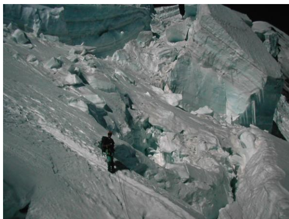
Sota l'amenaça dels seracs

Passats el Grand i el Petit Plateau, la ruta voreja els perillosos seracs que es desprenen de l'Aiguille du Goûter. Les esquerdes sovintegen i cal saltar-les.