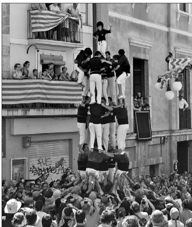
➔ A dalt a l'esquerra, la Jove i a la dreta el dels Xiquets. Sota a l'esquerra, el 4d7a del Serrallo i a la dreta, el de Sant Pere i Sant Pau.

descarregaven el seu primer 4 de 7 amb l'agulla de l'any. L'última ronda, amb