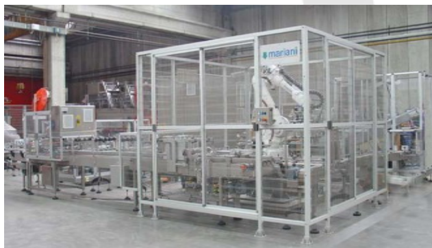
Робот Pick and Place