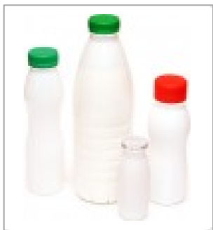
➔ Молочные продукты