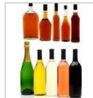
➔ Вина и ликеры

Линия производства для розлива жидкостей: