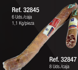
SALCHICHÓN IBÉRICO ENTERO/MITADES