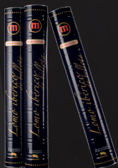
LATA LOMO IBÉRICO DE BELLOTA