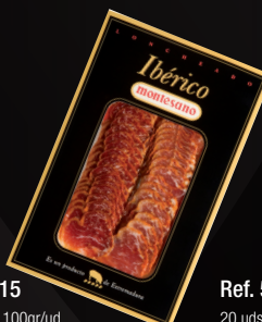
LOMO IBÉRICO BELLOTA EXTRA