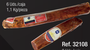
LOMO IBÉRICO DE BELLOTA ENTERO/MITADES