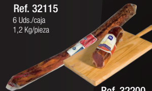
LOMO IBÉRICO DE CEBO ENTERO/MITADES