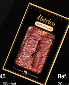
SALCHICHÓN IBÉRICO EXTRA