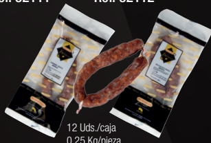
CHORIZO/SALCHICHÓN SARTA IBÉRICO