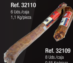
CHORIZO IBÉRICO ENTERO/MITADES