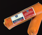
SOBRASADA IBÉRICA VELA