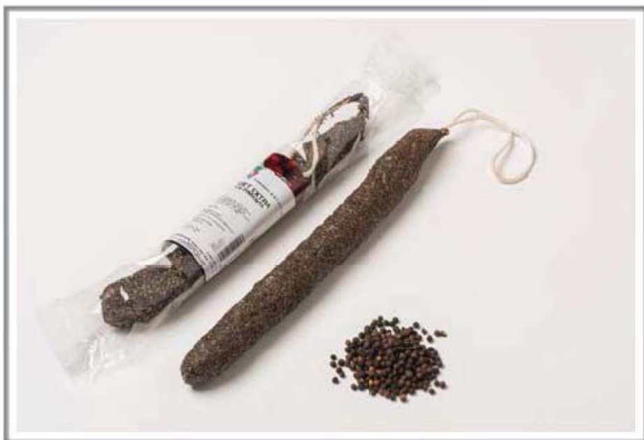
Pimienta / Black pepper / Poivre noir Черный перец