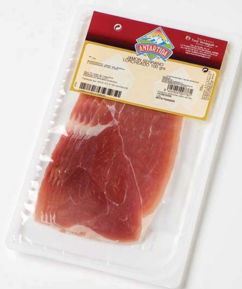
REF.776 Ломтики хаммон 100г Серрано