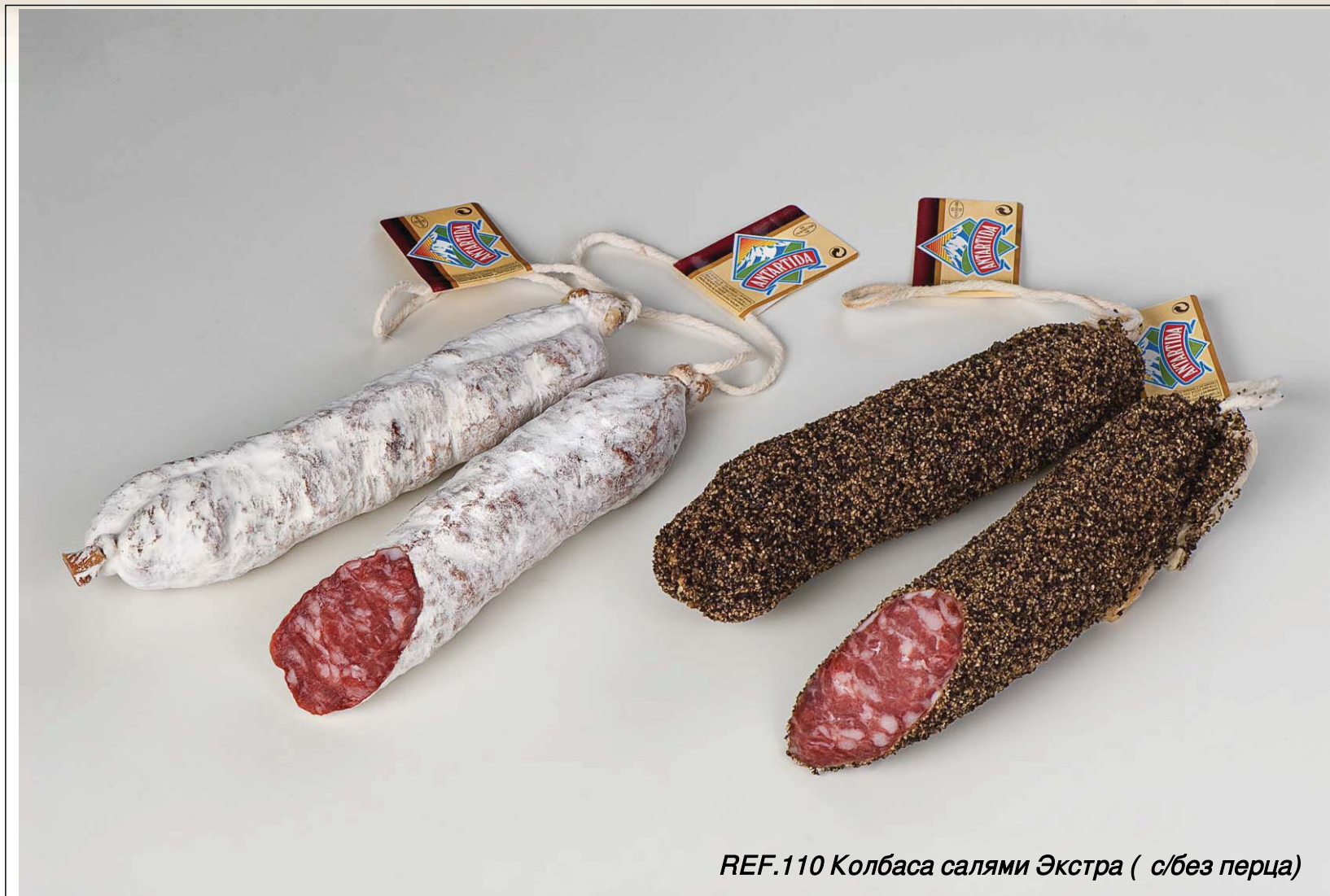
REF.110 Колбаса салями Экстра ( с/без перца)