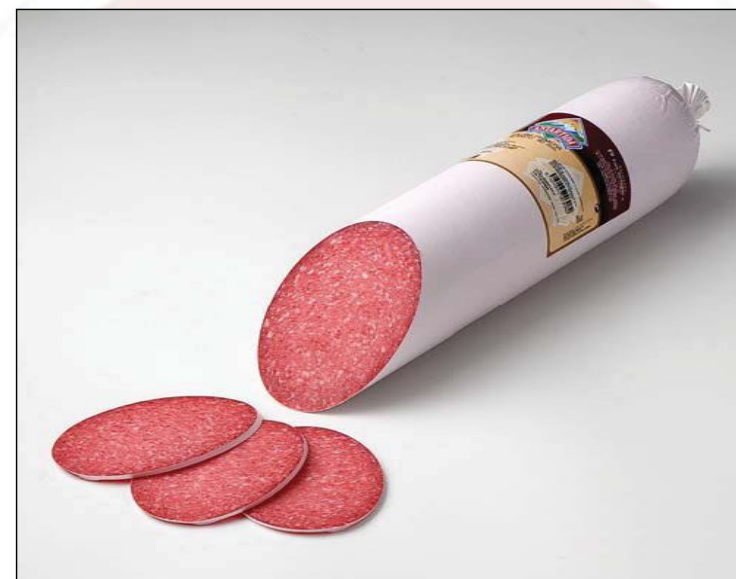
REF 308 Салами 90 мм в белой шкурке