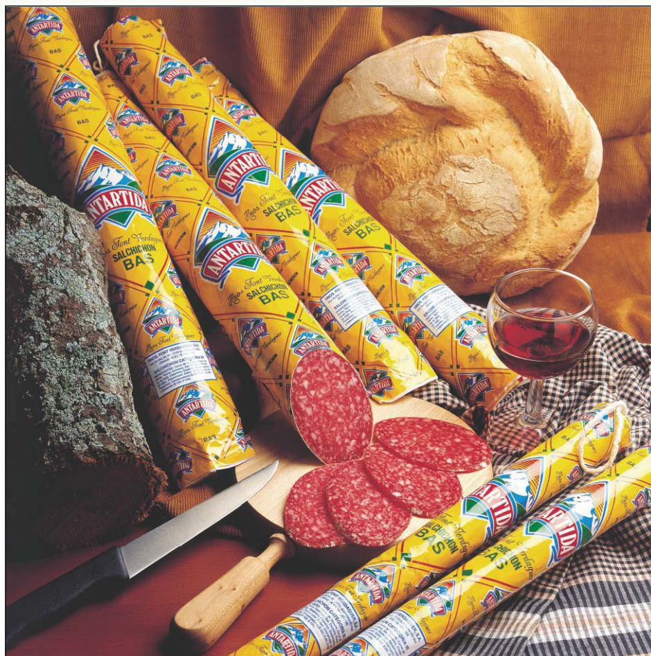
REF.131 Колбаса Терсера 90мм