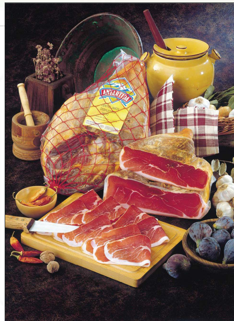
REF.565 Хамон Серрано