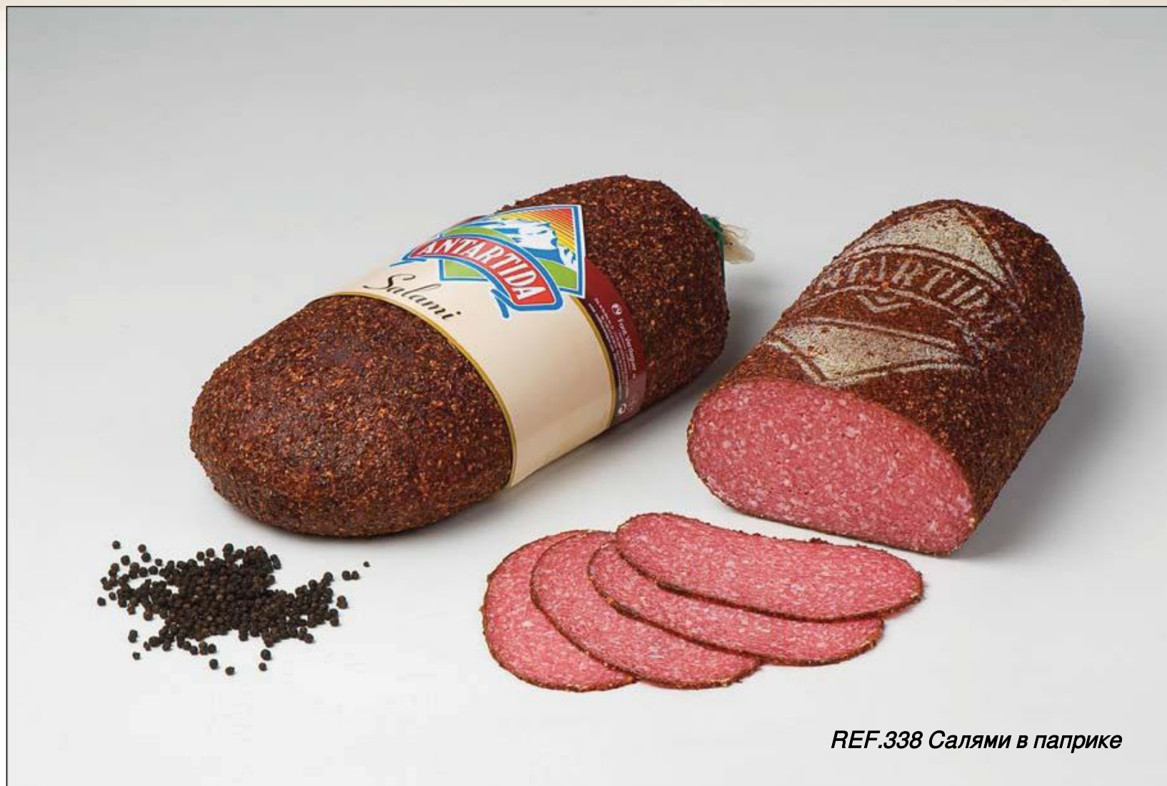
REF.338 Салями в паприке