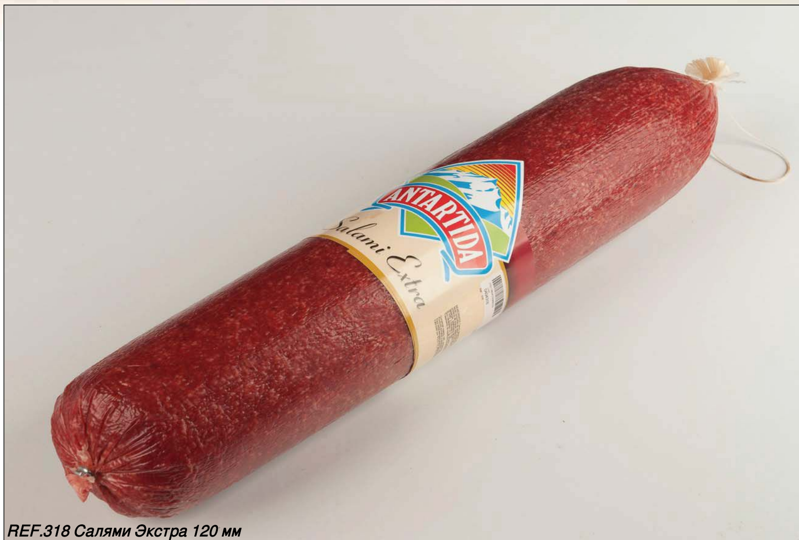
REF.318 Салами Экстра 120 мм