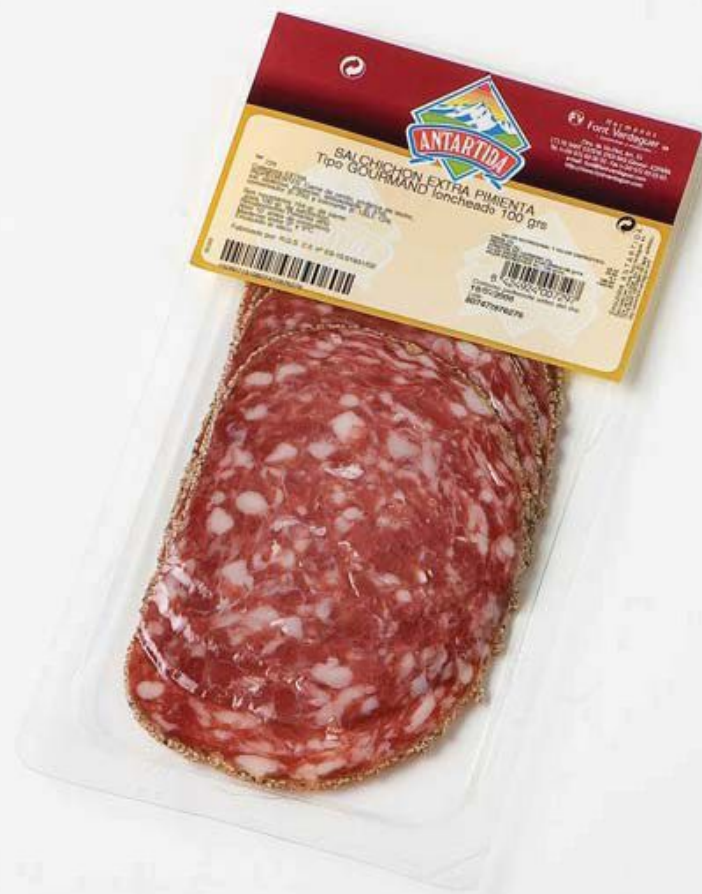
REF.721 колбаса ломтиками 70г в перце