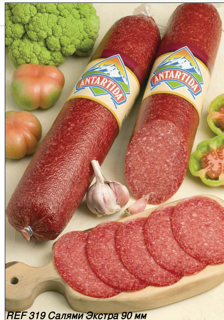
REF 319 Салями Экстра 90 мм