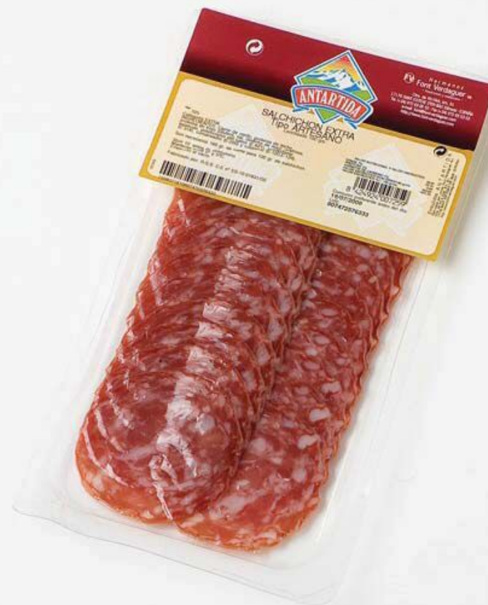
Колбаса экстра 70г ломтиками