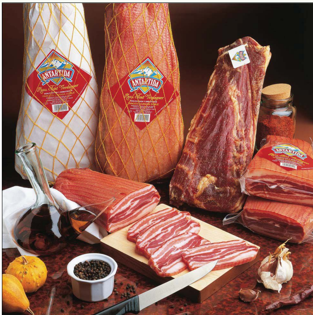
REF 513 Двойной бекон