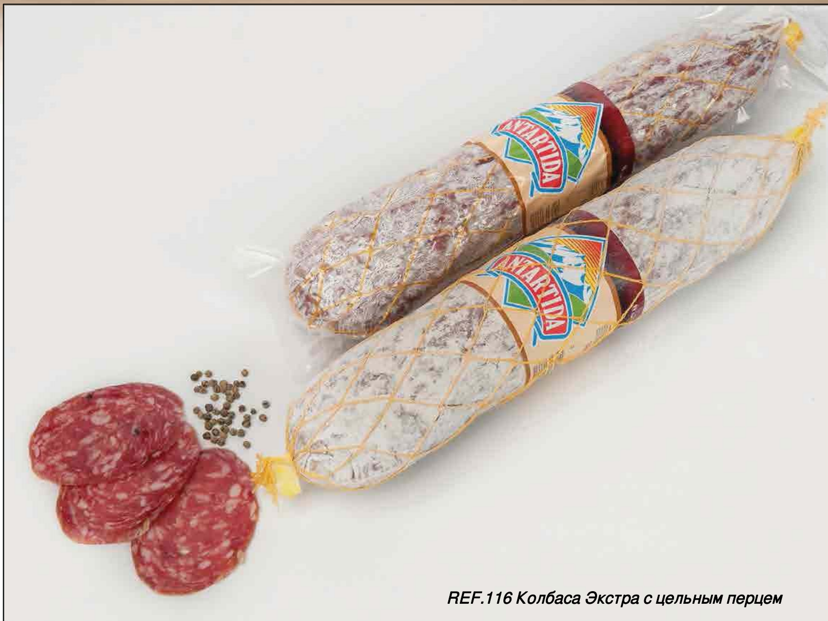
REF.116 Колбаса Экстра с цельным перцем