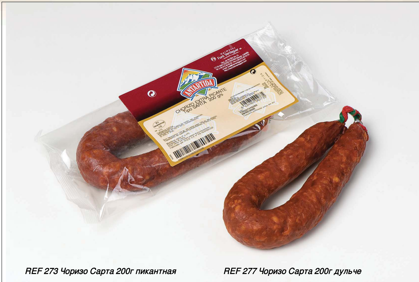
REF 273 Чоризо Сарта 200г пикантная