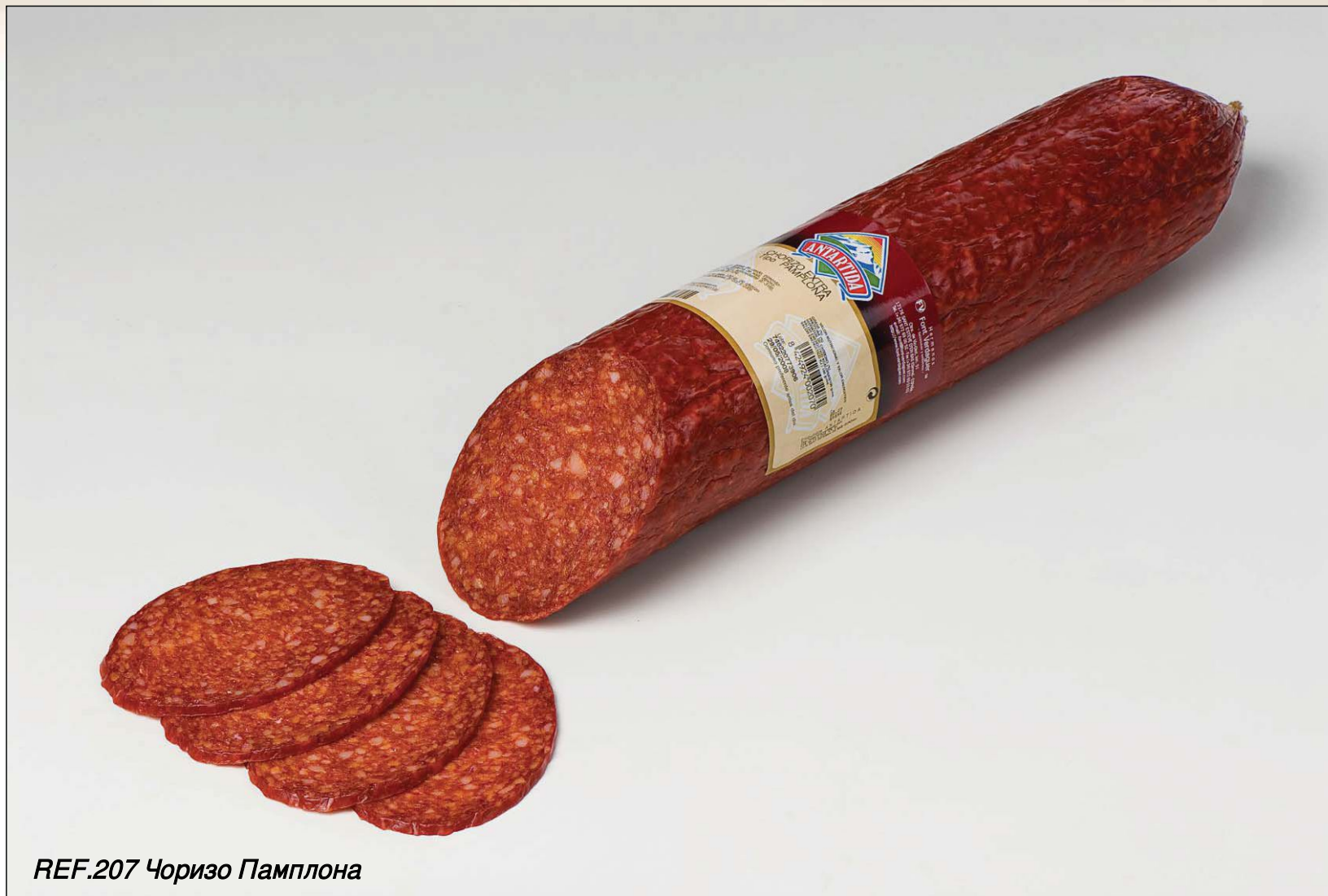
REF.207 Чоризо Памплона