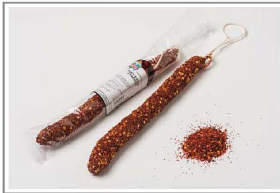
Pimentón / Paprika / Poivron rouge Паприка