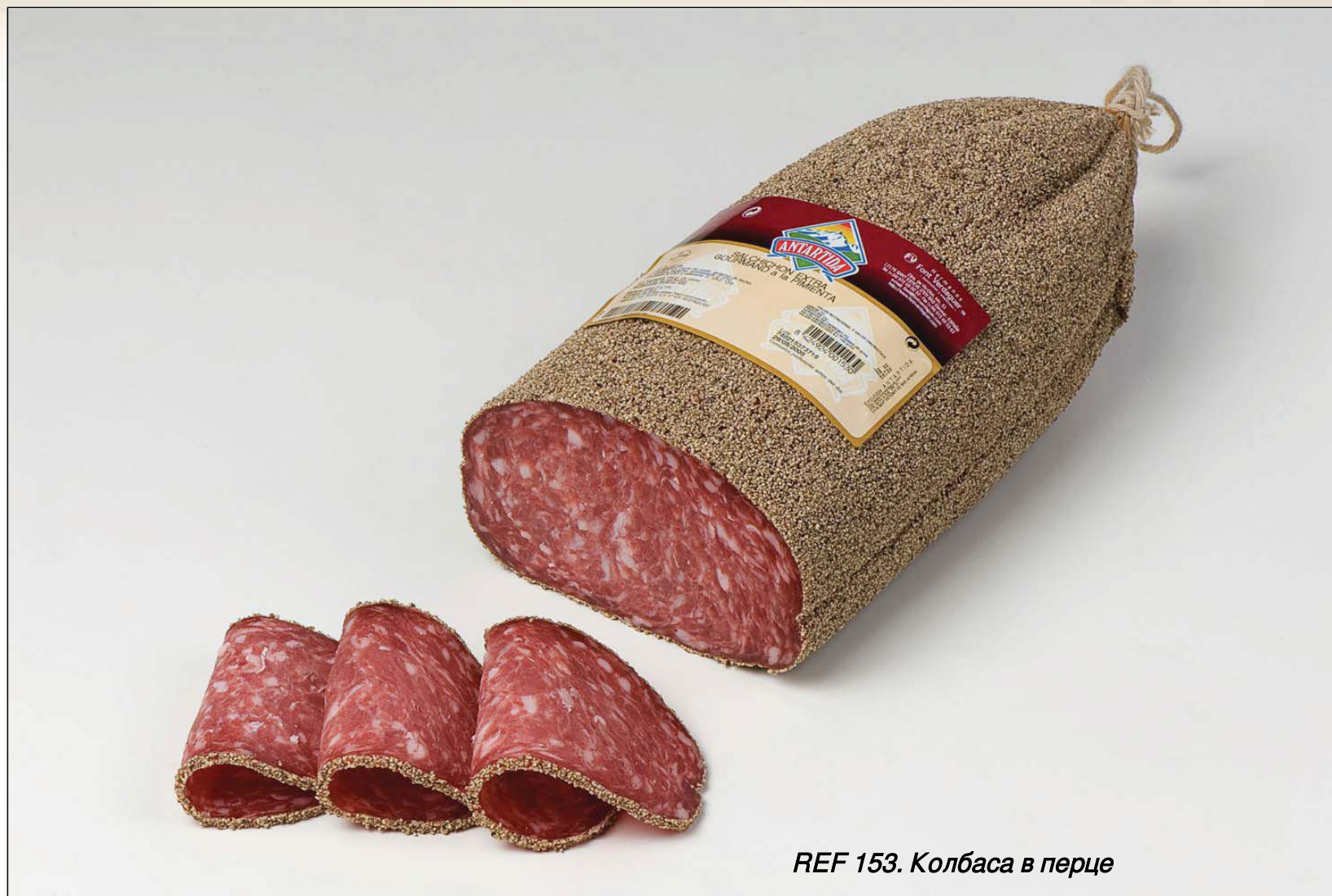
REF 153. Колбаса в перце