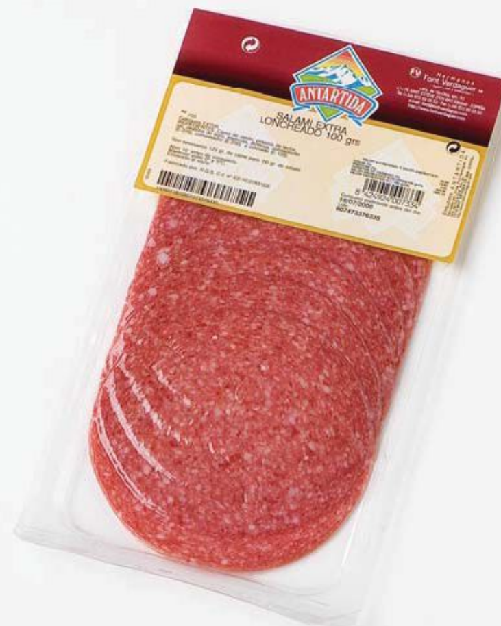
REF.600 Ломтики салями 70г