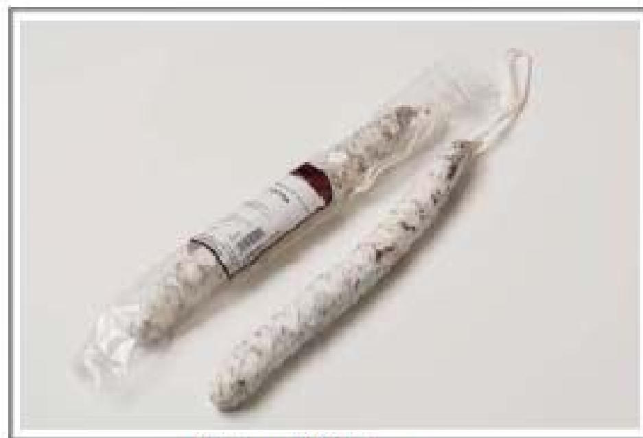
Natural / Nature Натураль