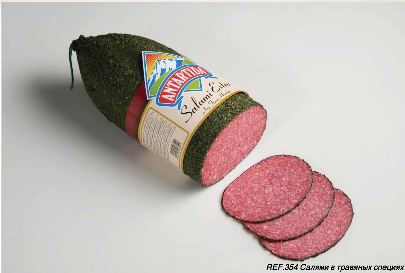
REF.354 Салями в травяных специях