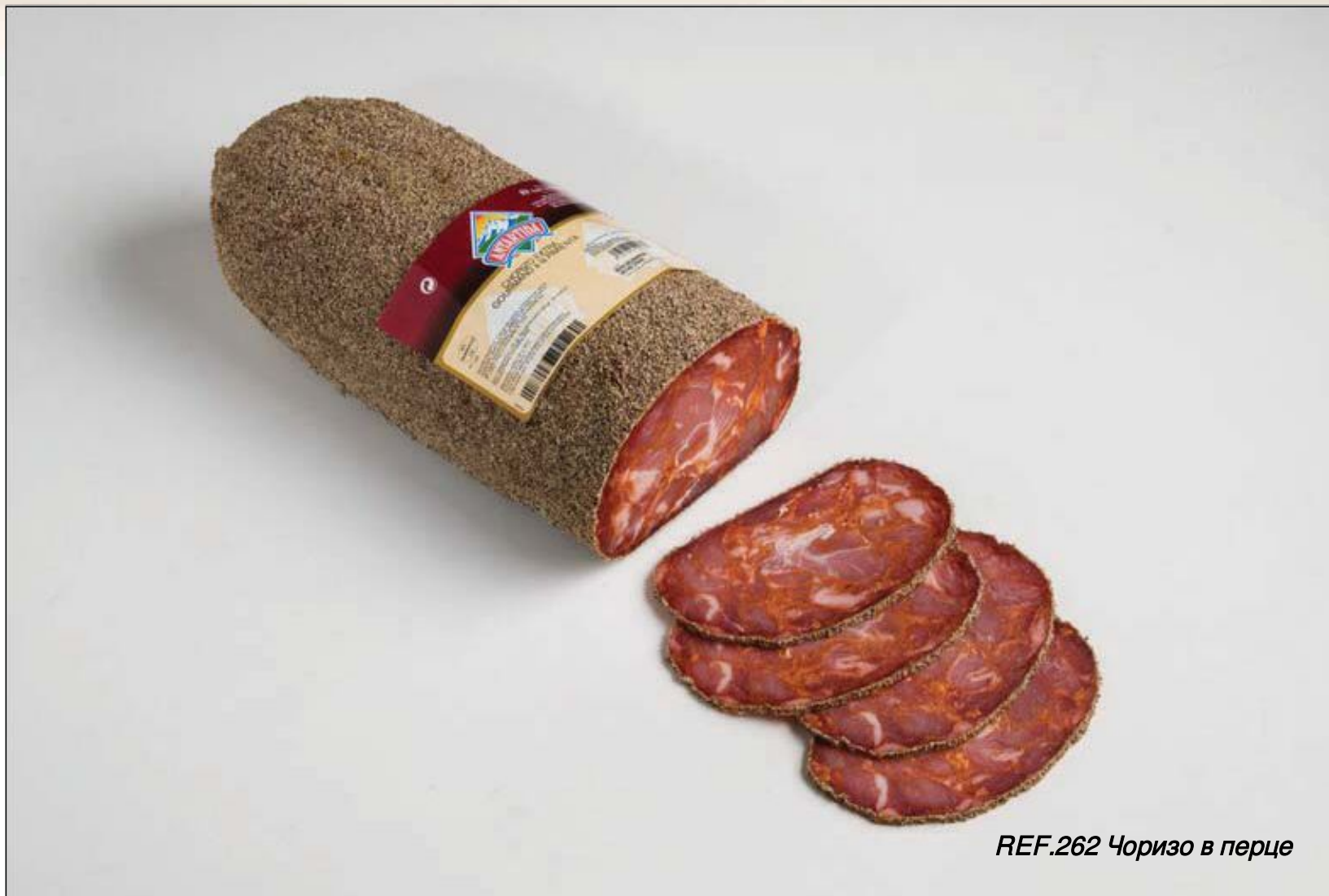
REF.262 Чоризо в перце