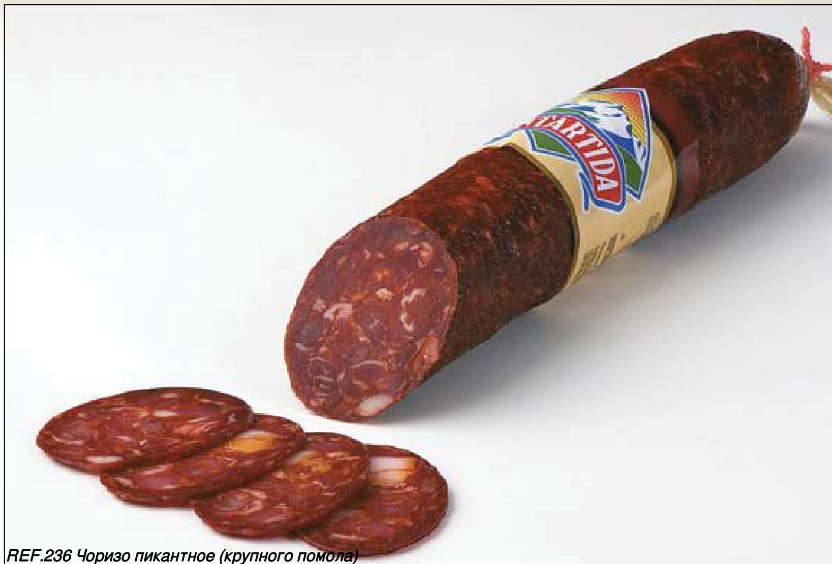
REF.236 Чоризо пикантное (крупного помола)