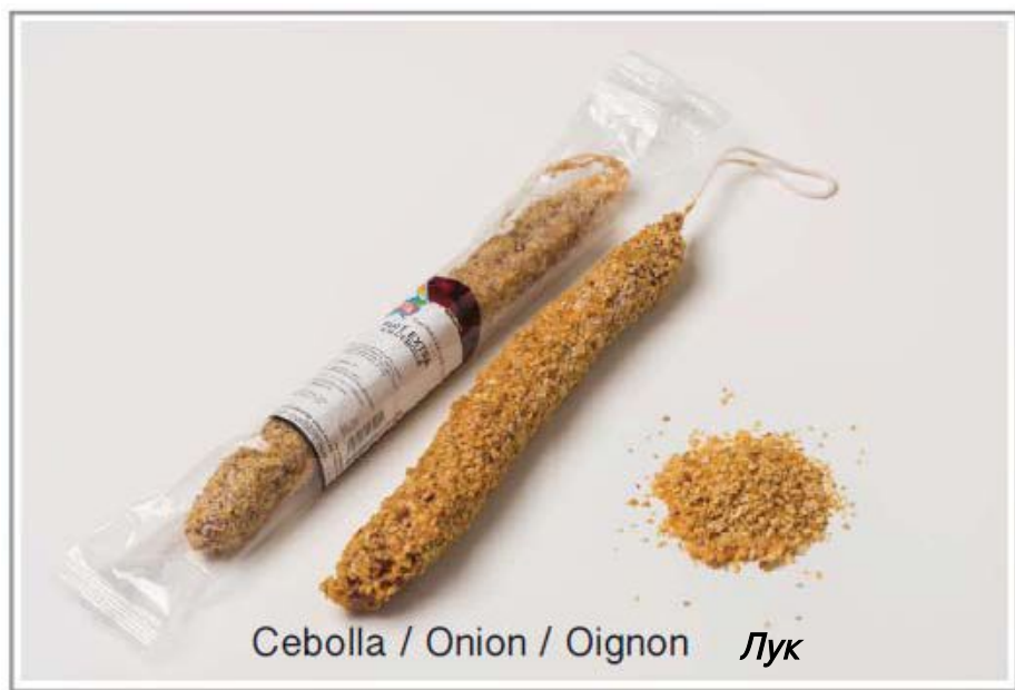
Cebolla / Onion / Oignon Лук