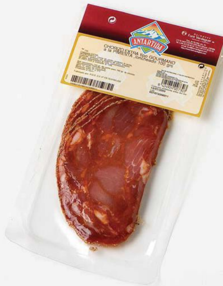
REF.722 Ломтики чоризо в перце 70 г