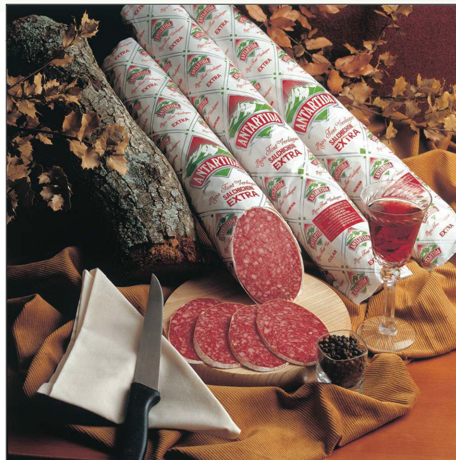
REF.109 Колбаса Олотская со шкуркой