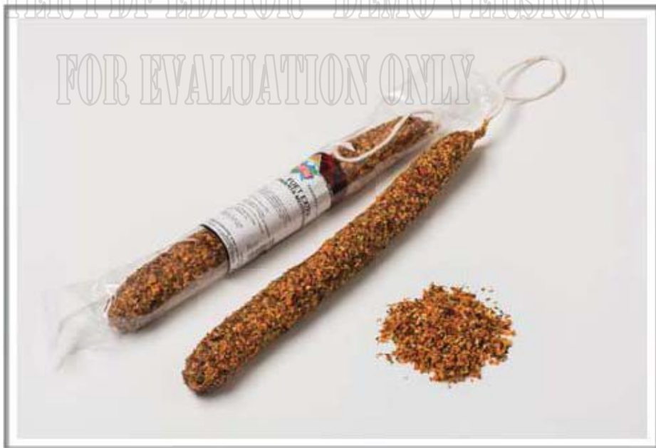
Mediterráneo / Mediterranean Средземноморские