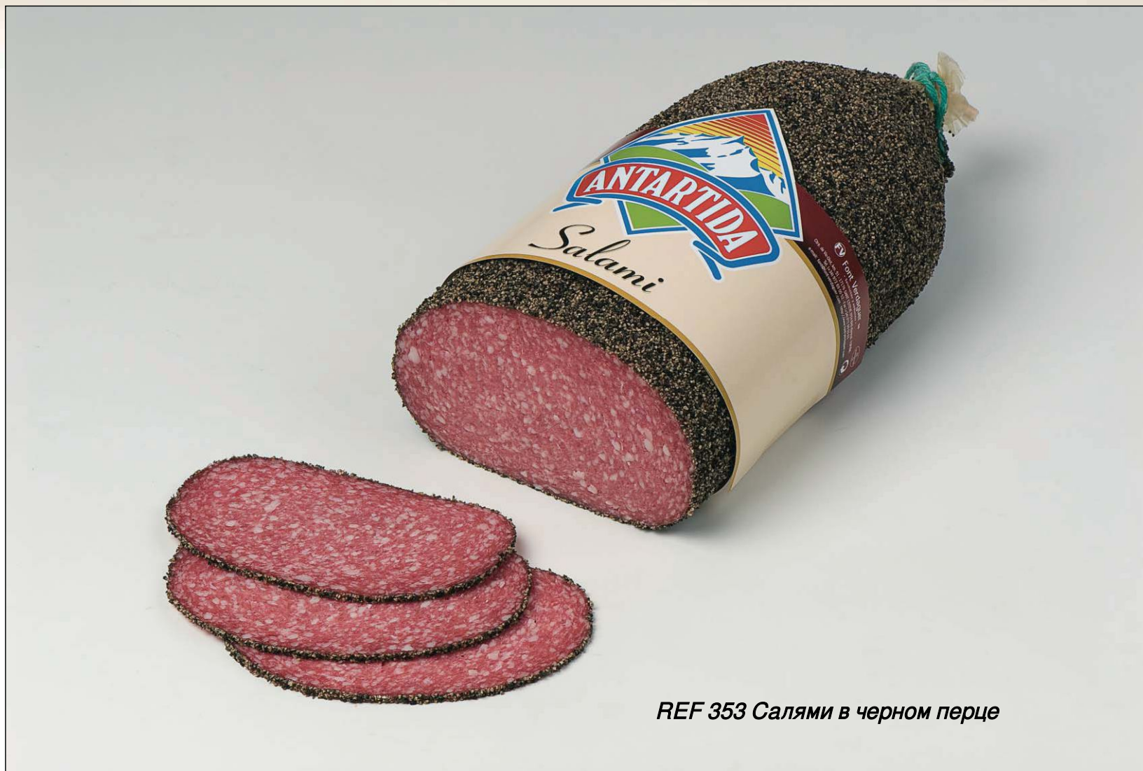
REF 353 Салями в черном перце