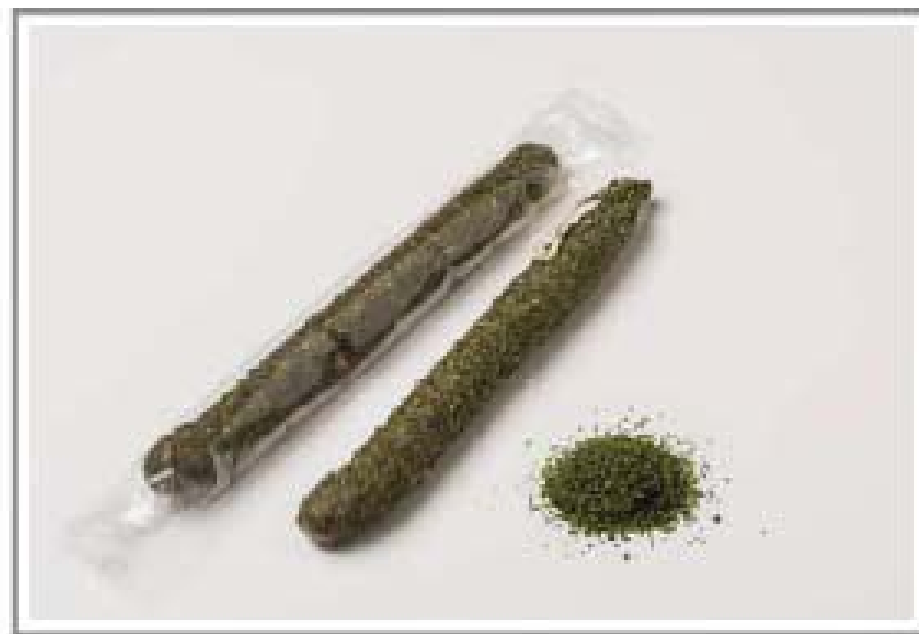
Finas hierbas / Fines herbs