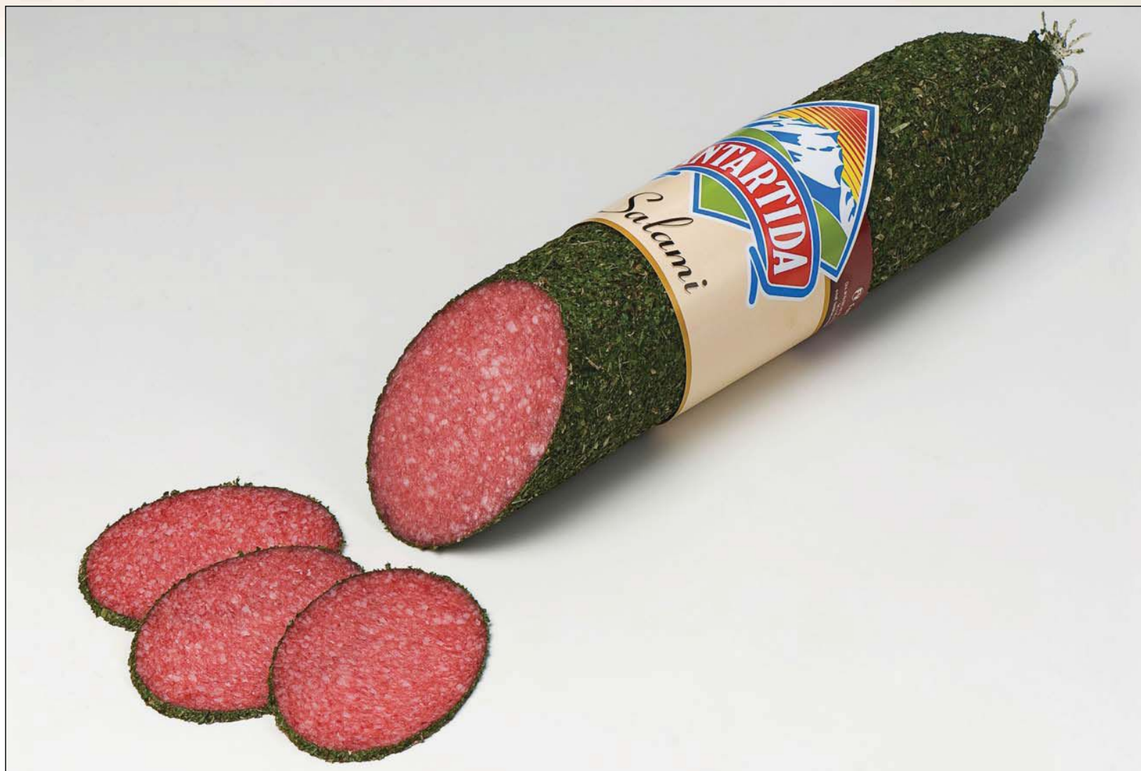
REF.357 Салями Экстра в травах (90мм)