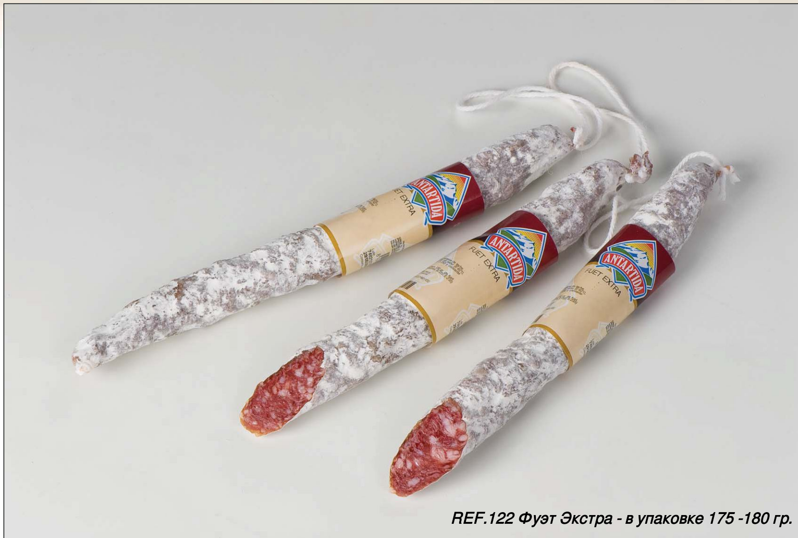
REF.122 Фуэт Экстра - в упаковке 175 -180 гр.