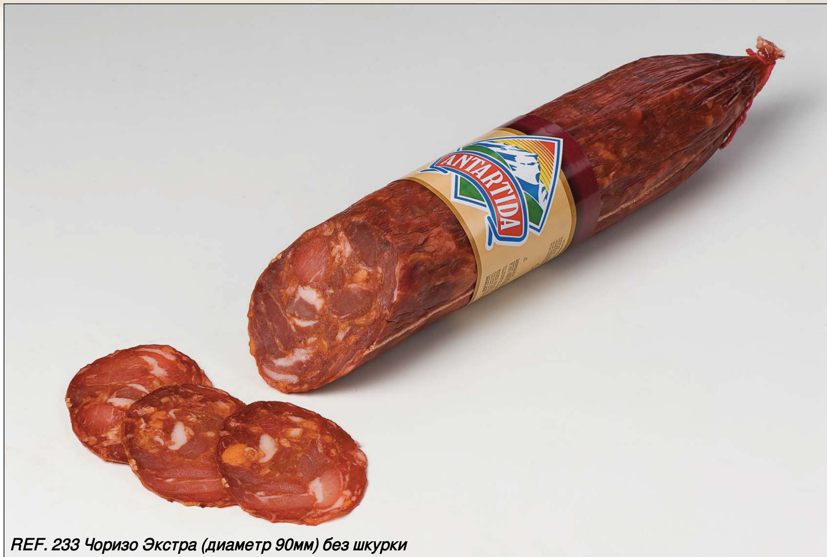
REF. 233 Чоризо Экстра (диаметр 90мм) без шкурки