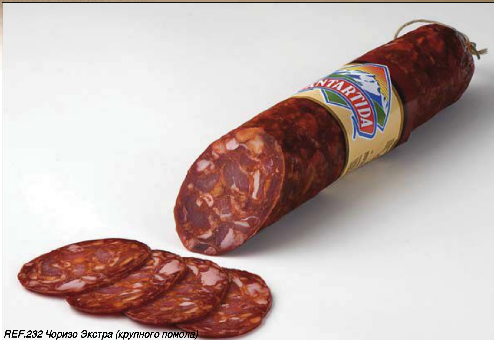
REF.232 Чоризо Экстра (крупного помола)