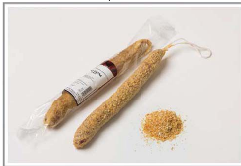
Ajo / Garlic / Ail Чеснок