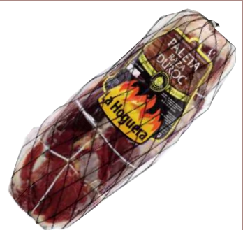
Палета без кости Порода Дюрок