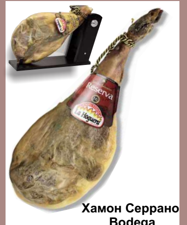
Хамон Серрано Bodega