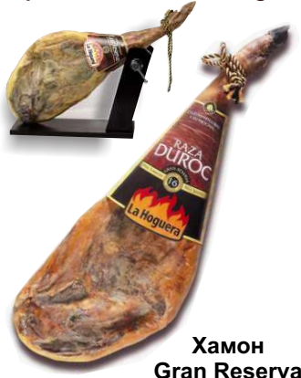
Хамон Gran Reserva