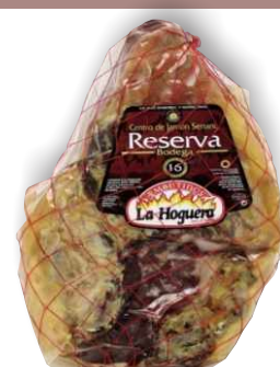
Хамон без кости Reserva зачищенный