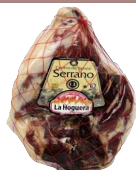
Хамон Серрано без кости зачищенный