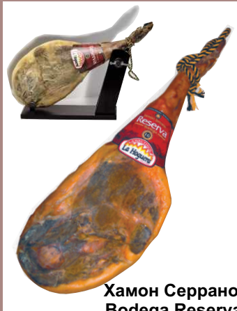
Хамон Серрано Bodega Reserva