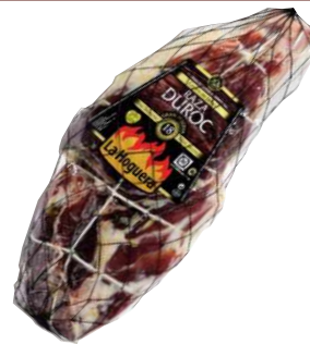
Хамон без кости Gran Reserva зачищенный