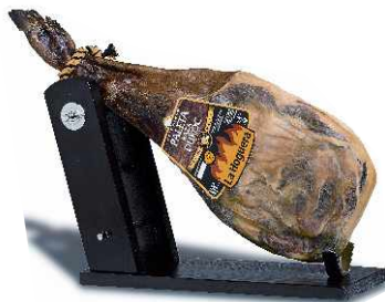
Палета Порода Дюрок