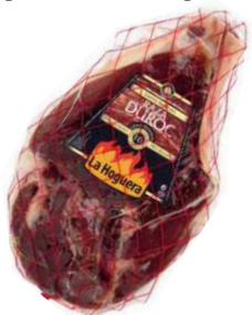
Хамон без кости зачищенный