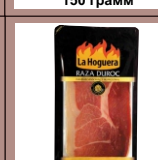
Хамон нарезка 150 грамм