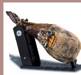
Палета Порода Дюрок