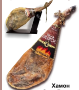
Хамон Gran Reserva