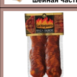
Нарезка Чоризо по домашнему 125 грамм