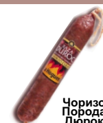
Чоризо Порода Дюрок