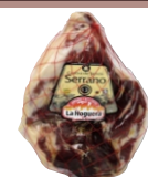
Хамон Serrano без кости зачищенный