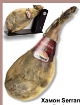
Хамон Serrano Bodega