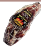
Хамон без кости Gran Reserva зачищенный