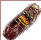
Палета без кости Порода Дюрок