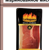
Хамон нарезка 100 грамм