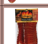
Балык нарезка 100 грамм