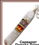
Сервилат Порода Дюрок