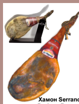
Хамон Serrano Bodega Reserva