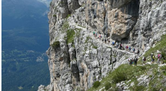
Sender Breitei concorregut

no n'estem acostumats, aquí hi ha molta més afició que a casa nostra. Els refugis Tuckett i Sella dominen la vall. Més endavant una bifurcació molt senyalitzada com totes, ens permet remuntar la veïna vall Breitei Alta, un itinerari espectacular de grans espais, fins el refugi Breitei. Renunciem a pujar al refugi Alimonta pels núvols. De baixada visitarem el nou sender de les cascades abans del refugi Vallesinella, on un bus ens retorna al cotxe.