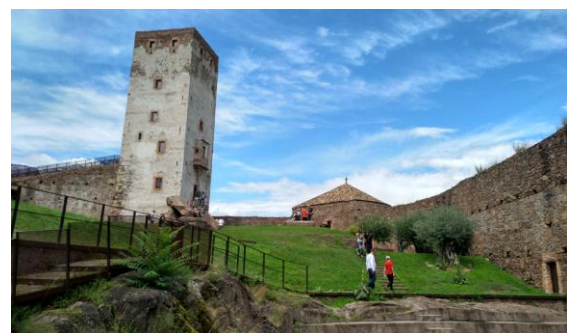
Museu Messner a Bolzano

Fugint de la pluja, canviem de plans i anem a Bolzano (Bozen) la capital del Südtirol que fa 100 anys pertanyia a l'imperi austrohongarès. Al castell Firmiano hi ha un dels sis Museus Messner, molt interessant. Dormirem a Madonna di Campiglio, als Dolomites de Brenta. Avui, viatjar amb cotxe per Europa es molt més fàcil que fa vint anys, amb el Google Maps i el Booking al mòbil no hi ha problemes en trobar qualsevol lloc, es pot improvisar i no cal fer reserves prèvies d'allotjament. El darrer dia, des de Campo Carlo Magno, a 2km al nord de Madonna, el telefèric ens puja al Passo Grosté, a 2.437m on hi ha el refugi A. Stoppani. El sender 316 planeja entre el rocam, molta gent una altra vegada,