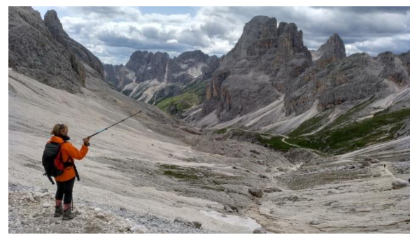
Grup Catinaccio des de Passo Principe

pel refugi Gardeccia, on es queden a passar el dia la majoria, i s'enfila cap el refugis Preuss i Vaiiolet, sota mateix de les impressionants agulles del mateix nom. Nosaltres volem arribar dalt de tot i seguim fins el final de la vall, el Passo Principe, a 2.601m. Fa vent i fred, dinem a l'atapeït interior i encabat baixem per agafar el sender 541 que remunta el vessant est de la vall oferint esplèndides panoràmiques des de dalt. La tarda avança i la tornada es fa llarga, passem alguna tartera descomposta i arribem just al telefèric.