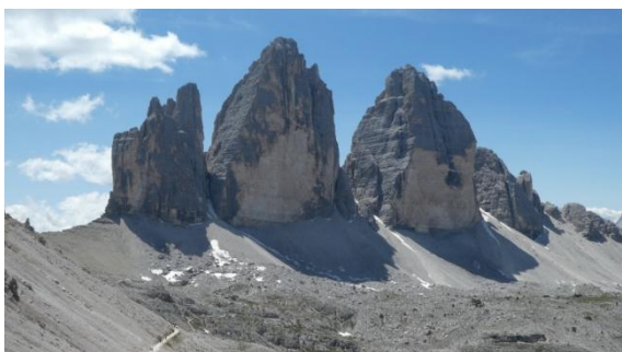
3 Cime di Lavaredo