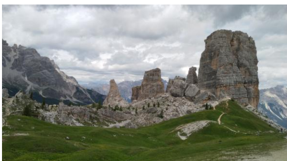
Grup 5 Torri

estrenem amb el tomb a les 3 Cime di Lavaredo, lloc emblemàtic i històric de l'escalada de dificultat en la seves cares nord. La ruta parteix del refugi Auronzo, a 2.320m, on es pot arribar en cotxe per carretera de peatge. L'itinerari és clar, només cal seguir el riu de gent de totes les edats que el fan. Els mapes i rètols indicadors numeren acuradament els senders, passem els refugis Lavaredo i Locatelli amb terrasses plenes a vessar, amb uns serveis de restauració que fan enveja i aprofitem el dia assolellat per fer bones fotos de l'espectacular paisatge alpí, amb els grups Tofane i Cadini a l'horitzó.