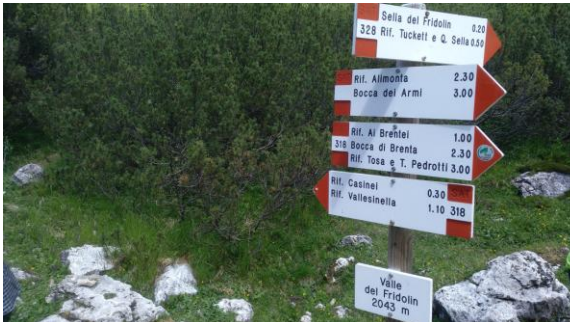
Informació als senders

no n'estem acostumats, aquí hi ha molta més afició que a casa nostra. Els refugis Tuckett i Sella dominen la vall. Més endavant una bifurcació molt senyalitzada com totes, ens permet remuntar la veïna vall Breitei Alta, un itinerari espectacular de grans espais, fins el refugi Breitei. Renunciem a pujar al refugi Alimonta pels núvols. De baixada visitarem el nou sender de les cascades abans del refugi Vallesinella, on un bus ens retorna al cotxe.