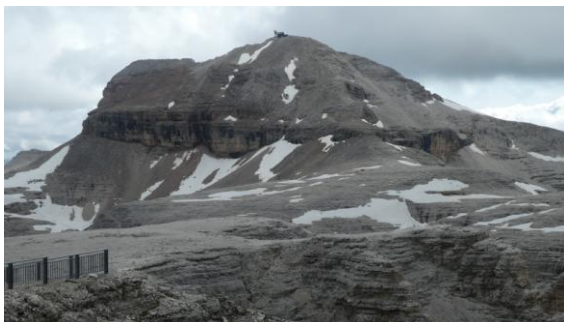
Piz Boé des del telefèric

El Piz Boé, de 3.162m, és el punt culminant del grup Sella, muralla ciclòpia que s'alça sobre el Pass Pordoi, més amunt de Canazei, el bonic centre turístic de la Val di Fassa. El telefèric de Sass Pordoi puja 600m fins la Forcella Pordoi, on el refugi del mateix nom serveix de punt de sortida per l'ascensió al pic, visible perfectament. Un riu de gent con altres dies s'enfila pel sender que zigzagueja pel vessant rocallós, on uns cables i esglaons asseguren alguns passos fàcils. El dia és tapat i amenaçador. Al cim, sorprenentment, trobem un refugi, la