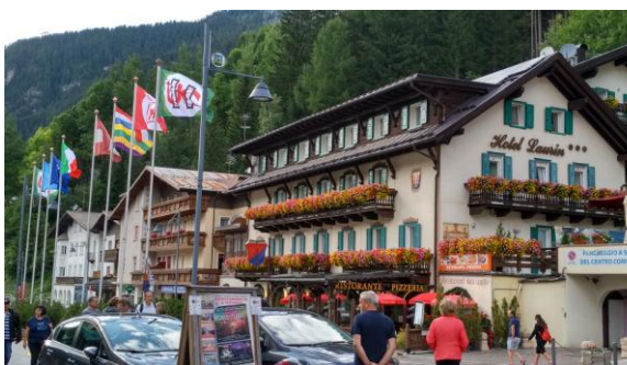
Canazei, centre de la Val di Fassa

Capanna Piz Fassa, amb la terrassa concorreguda com una platja a l'estiu i el restaurant a ple rendiment. Un gran reflector pla de microones treu més encant a l'indret. Mengem quelcom, fem les fotos i baixem. Seguint al nord, el sender es despenja pel pedregar, amb escales de fusta i caramells de glaç a les parets. El refugi Boé ocupa el coll on canviem de ruta i tornem entre congestes fins el telefèric, mentre una mica de neu granulada es despenja dels núvols.