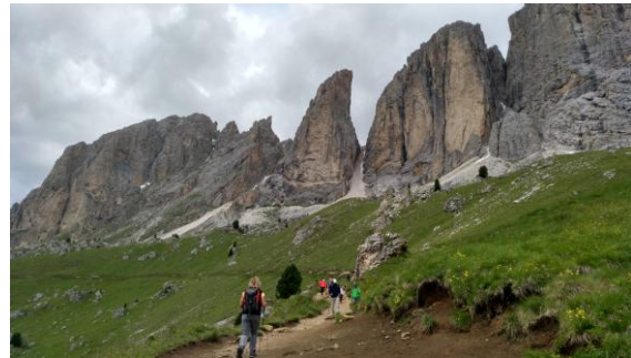
Friedrich August weg

El temps insegur ens convida a canviar de lloc, anem a l'oest, a la Val di Fassa, una autèntica sorpresa per a nosaltres, amb paisatges magnífics. El telefèric del Col Rodella ens puja al peu del massís de Sassolungo, el sender Friedrich August Weg planeja sota un cel amenaçador pels refugis Sandro Pertini i més endavant el Sasso Piatto (Plattkofel). La pluja ens obliga a aixoplugar-nos-hi. Dinem salsitxa amb pa i formatge que el mateix guàrdia i la seva família de parla alemanya elaboren i tot seguit prenem el sender que baixa cap al refugi Micheluzzi i la Val Duron en una llarga tornada a Campitello di Fassa, on tenim l'allotjament. A l'endemà, des de Vigo di Fassa, el telefèric del Catinaccio puja fins el refugi Ciampedie. El sender-pista 540, també amb molta gent, passa