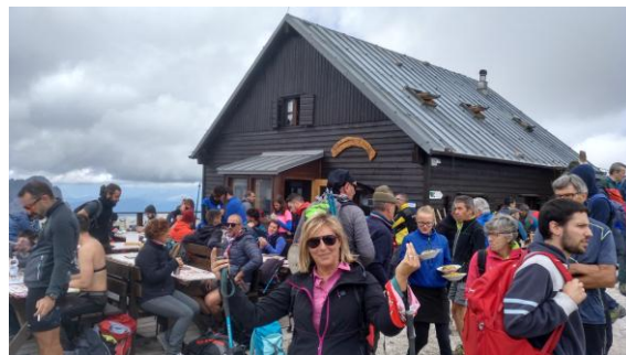
Cim del Piz Boé

Capanna Piz Fassa, amb la terrassa concorreguda com una platja a l'estiu i el restaurant a ple rendiment. Un gran reflector pla de microones treu més encant a l'indret. Mengem quelcom, fem les fotos i baixem. Seguint al nord, el sender es despenja pel pedregar, amb escales de fusta i caramells de glaç a les parets. El refugi Boé ocupa el coll on canviem de ruta i tornem entre congestes fins el telefèric, mentre una mica de neu granulada es despenja dels núvols.