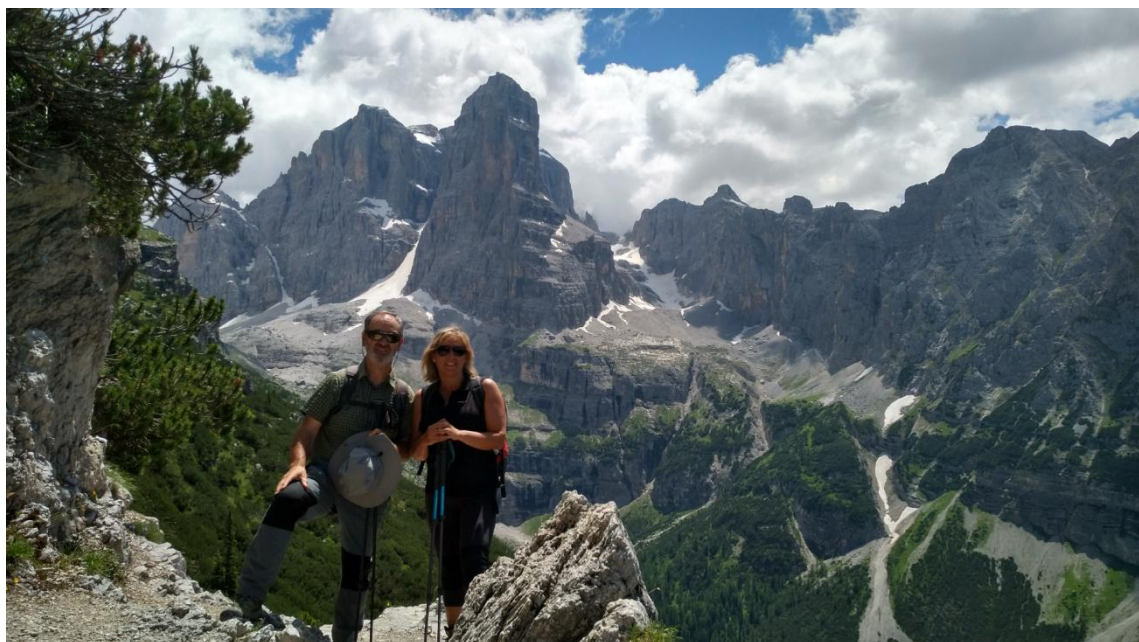
Val Breitei Alta i Cima Tosa

Més detalls a: https://ca.wikiloc.com/wikiloc/spatialArtifacts.do