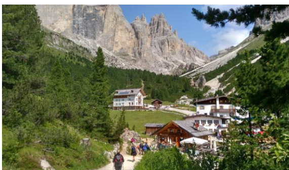
Complex del refugi Gardeccia

El temps insegur ens convida a canviar de lloc, anem a l'oest, a la Val di Fassa, una autèntica sorpresa per a nosaltres, amb paisatges magnífics. El telefèric del Col Rodella ens puja al peu del massís de Sassolungo, el sender Friedrich August Weg planeja sota un cel amenaçador pels refugis Sandro Pertini i més endavant el Sasso Piatto (Plattkofel). La pluja ens obliga a aixoplugar-nos-hi. Dinem salsitxa amb pa i formatge que el mateix guàrdia i la seva família de parla alemanya elaboren i tot seguit prenem el sender que baixa cap al refugi Micheluzzi i la Val Duron en una llarga tornada a Campitello di Fassa, on tenim l'allotjament. A l'endemà, des de Vigo di Fassa, el telefèric del Catinaccio puja fins el refugi Ciampedie. El sender-pista 540, també amb molta gent, passa