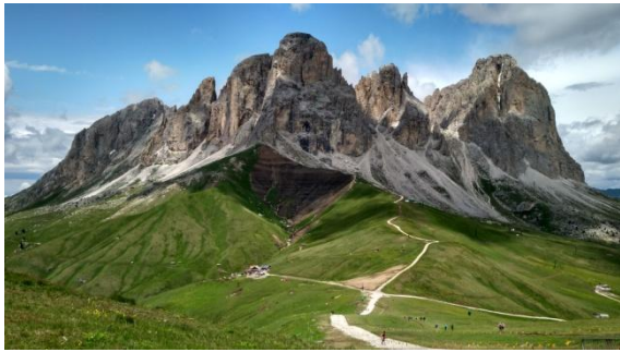
Grup Sassolungo (Langkofel)

i solitari, després pel típic pedregar dolomític que a l'hivern acull pistes d'esquí. El refugi està situat en plena cresta, sols es pot continuar per una via ferrada que baixa. Dinem i retornem passant pels refugis Averau i Scoiattoli, on arriben sengles telefèrics que aboquen molta gent caminadora. El dia és amenaçador i la tornada rodejant el grup de roques anomenades 5 Torri acabarà amb pluja, que guarneix l'ampli paisatge del massís del Cristallo sobre el nucli de Cortina.