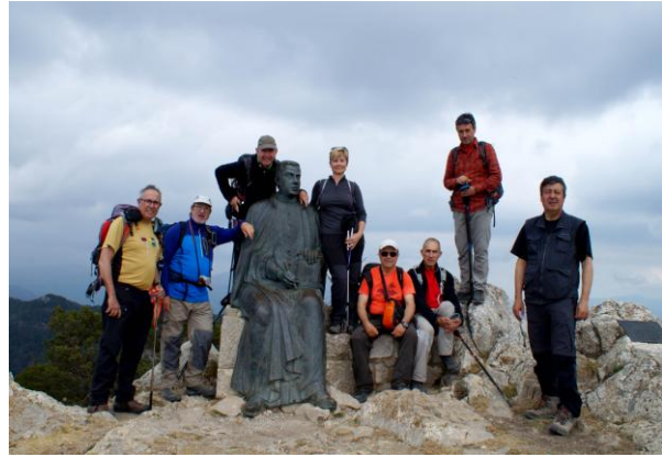
Cim del Mont

d'aquí el sender desdibuixat i quasi inexistent ens mena entre mig d'alzinars amb fort pendent per un camí anomenat de l'alzina del Mal Pas. Anem sempre direcció SO. fins als Plans d'en Vilà. I després continuem per un corriol tipus torrentera marcat amb senyals vermells fins prop de Can Tries. Seguim uns metres per la carretera, passem a frec del mas de Coldejou, font i bassa/safareig de la Quera i arribem a Beuda quan ja s'inicia una bona tempesta.