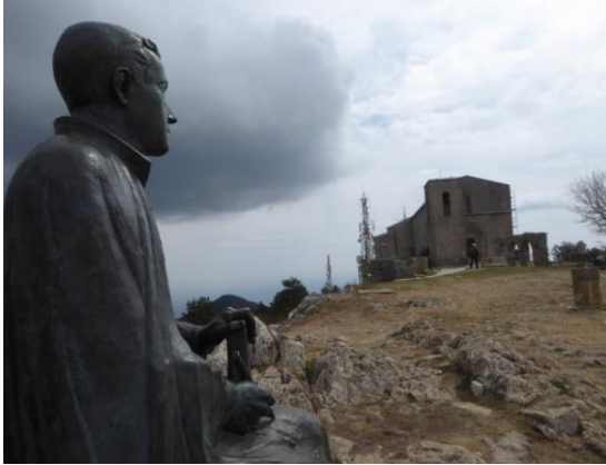
Santuari de la M.D. del Mont