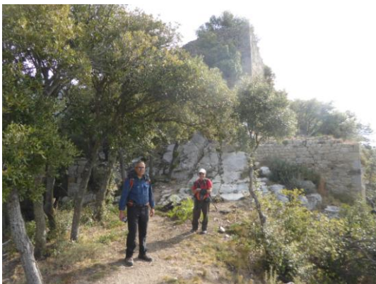
El Castell de Beuda

Junt al Santuari hi ha un restaurant i una hostatgeria, que servia la cambra on sojornà mossèn Cinto Verdaguer durant l'estiu de 1884. En aquest indret la solitud i la contemplació del proper massís del Canigó van continuar alimentant la inspiració del gran poeta. A l'esplanada del cim, davant del Santuari hi ha el monument de mossèn Cinto, inaugurat el 2008, que palesa la seva eremítica estada.