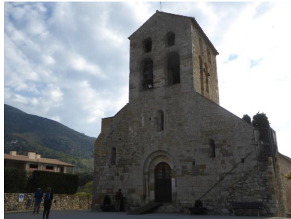
Sant Feliu de Beuda

Junt al Santuari hi ha un restaurant i una hostatgeria, que servia la cambra on sojornà mossèn Cinto Verdaguer durant l'estiu de 1884. En aquest indret la solitud i la contemplació del proper massís del Canigó van continuar alimentant la inspiració del gran poeta. A l'esplanada del cim, davant del Santuari hi ha el monument de mossèn Cinto, inaugurat el 2008, que palesa la seva eremítica estada.