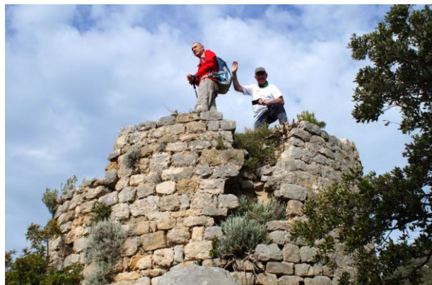
Torre circular s.XI