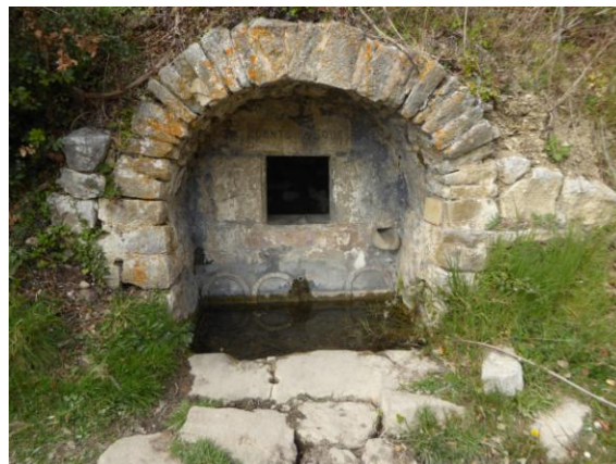
Font dels Monjos

Continuem camí, quinze minuts per esmorzar, de 11:00 a 11:15 hores i pujada forta cap el turó de les Grives i cap el Pujant del Grau, per tal de superar les cingleres de Roca Pastora. Cinc minuts abans de les dotze arribem a la font dels Monjos i als vestigis del monestir benedictí de Sant Llorenç de Sous. Possiblement la seva decadència i èxode varen començar amb els ensulsiments provocats pels terratrèmols del 1427 i 29.