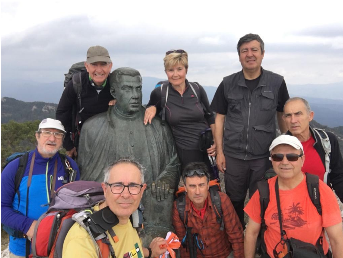
Amb Mossèn Cinto al Mont

d'aquí el sender desdibuixat i quasi inexistent ens mena entre mig d'alzinars amb fort pendent per un camí anomenat de l'alzina del Mal Pas. Anem sempre direcció SO. fins als Plans d'en Vilà. I després continuem per un corriol tipus torrentera marcat amb senyals vermells fins prop de Can Tries. Seguim uns metres per la carretera, passem a frec del mas de Coldejou, font i bassa/safareig de la Quera i arribem a Beuda quan ja s'inicia una bona tempesta.