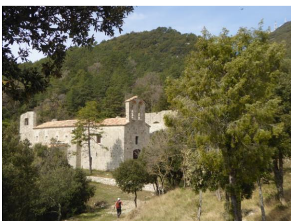
Monestir de Sant Llorenç de Sous

Continuem camí, quinze minuts per esmorzar, de 11:00 a 11:15 hores i pujada forta cap el turó de les Grives i cap el Pujant del Grau, per tal de superar les cingleres de Roca Pastora. Cinc minuts abans de les dotze arribem a la font dels Monjos i als vestigis del monestir benedictí de Sant Llorenç de Sous. Possiblement la seva decadència i èxode varen començar amb els ensulsiments provocats pels terratrèmols del 1427 i 29.