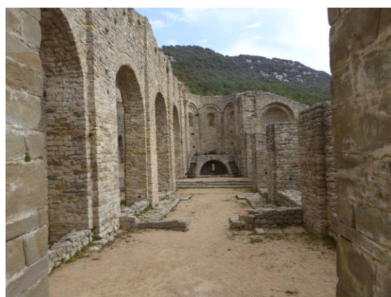
Restes de l'Església

A les 12:10 h. iniciem la darrera pujada i pels vols de la una del migdia arribem al Santuari de la Mare de Déu del Mont i a l'esplanada del cim coronada per l'estàtua de mossèn Cinto Verdager. A mesura que el dia avança les nuvolades negres augmenten i la visibilitat s'enterboleix. No podem albirar la silueta del Canigó que tant va motivar l'esguard de mossèn Cinto. Dinem en un pis pas i tirem avall cap al collet de les Sorreres i cap al Pla de Solls. A partir