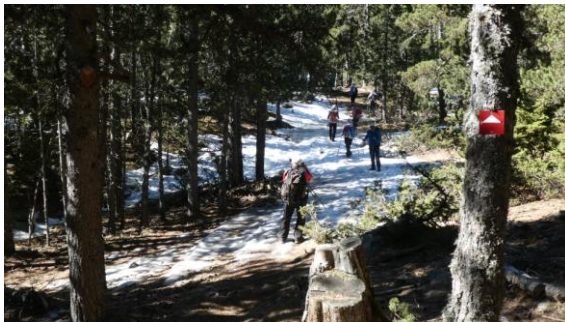
Restes de neu entre bosc

Últim cap de setmana d'hivern. Dissabte 16 pugem amb els cotxes de bon matí fins l'estació d'esquí nòrdic d'Aransa, a la Cerdanya. Com que fa setmanes que teníem les reserves fetes, no podíem preveure que la neu hagués minvat tant i ens hem trobat l'estació tancada i que molts trams del recorregut no tenien neu. Tot i això hem decidit deixar les raquetes i fer l'itinerari a peu. Prenent com a punt de partida el refugi del Fornell, a 1.890m, seguim les marques del circuit 6 que puja suaument entre un bosc orientat a llevant. Les restes de neu, sovint glaçades, obliguen a parar atenció per tal d'evitar una relliscada. El pendent és