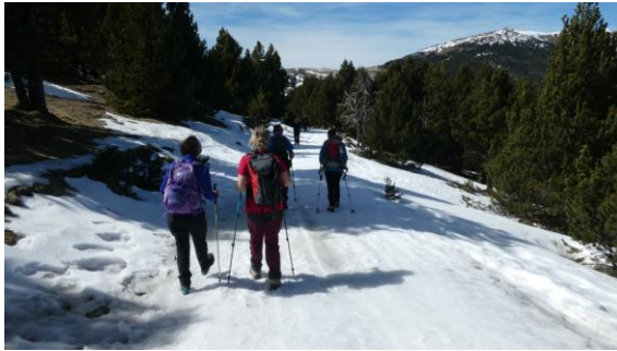
Baixada per pista

és un bon mirador just en el límit comarcal: al sud-est, l'Alt Urgell, els poblets de Bar i Toloriu i tancant-t'ho tot, la impressionant muralla nevada de la cara nord de la serra del Cadí. Al nord-est, la Cerdanya, tancada al nord per la carena fronterera amb el Principat d'Andorra que inclou des de la Tossa Plana de Lles (2.905m) al Monturull (2.761m). Cap a l'est s'obre la plana ceretana limitada per la Tossa d'Alp i el massís del Puigmal. El dia és clar i sense vent, el sol llueix fort en una primavera avançada. Restem una hora gaudint del panorama i reposant forces. Encabat, fem la baixada retornant al coll de