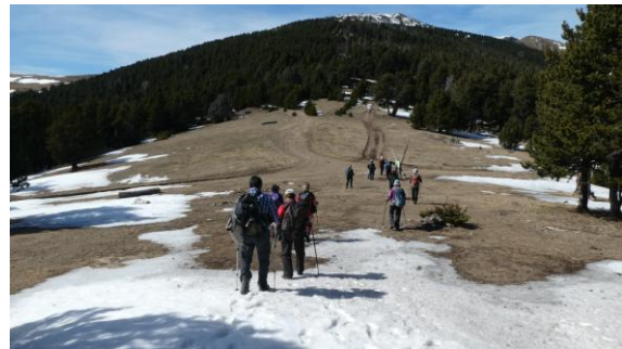
Coll de Queralt

moderat i anem progressant sense problemes. Fem cap a un primer replà i el bosc s'obre, és el coll de Queralt. Continuem amb poc pendent pel llom de la carena i en menys de dues hores som al punt culminant: el Mirador del Pla de Llet, de 2.144m d'alçada, inclòs a la llista del 100 Cims. Un monument de formigó amb una escultura metàl·lica assenyala l'indret, que com el nom indica