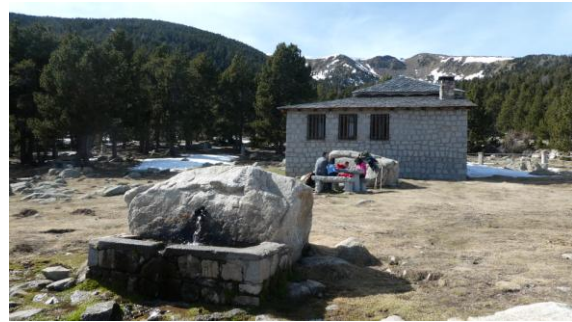
Refugi Prat Miró

Queralt i prenem una pista (circuit 4) que puja lleugerament i dóna un ampli retomb fins el refugi de Prat Miró i des d'allí, la baixada definitiva fins el Fornell i els cotxes.