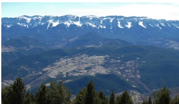
Bar, Toloriu i Serra del Cadí

moderat i anem progressant sense problemes. Fem cap a un primer replà i el bosc s'obre, és el coll de Queralt. Continuem amb poc pendent pel llom de la carena i en menys de dues hores som al punt culminant: el Mirador del Pla de Llet, de 2.144m d'alçada, inclòs a la llista del 100 Cims. Un monument de formigó amb una escultura metàl·lica assenyala l'indret, que com el nom indica