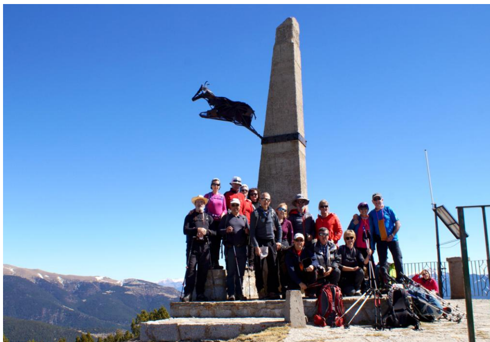
Mirador del Pla de Llet

La majoria farem nit a la fonda de Pas de la Pera al poble d'Aransa i a l'endemà farem una visita guiada, al costat del poblet de Mussa, a www.rocaviva.cat , un espai místic d'escultures en granit al mig d'una roureda. Després baixarem a Martinet a veure el Parc dels Búnquers de Martinet ( www.bunquersmartinet.net ) interessant vestigi força desconegut de la postguerra.