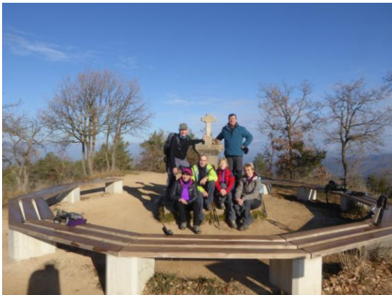
Cim Puig de la Caritat

Ja situat al peu de Puig, el camí el va rodejant tot guanyant alçada i l'assoleix pel vessant nord. A les 10:45h. ens estem fent la foto de grup vora el geodèsic d'aquest modest cim de bon esguard, anomenat de la Caritat per tal de recordar la processó que conduí l'abat del monestir l'any 1481 per protegir el terme d'una plaga de llagosta que assolà l'entorn.