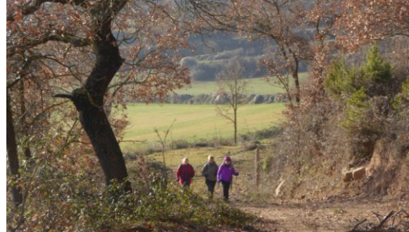
Camí del Puig

Ja situat al peu de Puig, el camí el va rodejant tot guanyant alçada i l'assoleix pel vessant nord. A les 10:45h. ens estem fent la foto de grup vora el geodèsic d'aquest modest cim de bon esguard, anomenat de la Caritat per tal de recordar la processó que conduí l'abat del monestir l'any 1481 per protegir el terme d'una plaga de llagosta que assolà l'entorn.