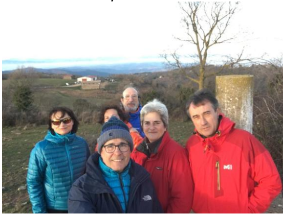
Cim Turó de Bellver 1r. Grup