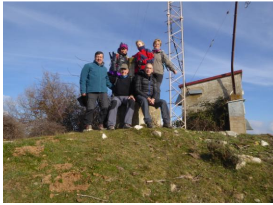
Cim Turó de Bellver 2n. Grup

Tot seguit anem a dinar al restaurant Cal Fornet de Collsuspina i a primera hora de la tarda ens apropem a l'església romànica de Sant Cugat de Gavadons i encara ens dóna temps de coronar el proper Turó de Bellver.