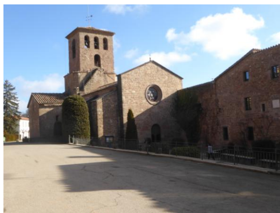
Monestir Santa Maria de l'Estany

Més prop de nosaltres, en els temps de la difusió de l'art romànic impulsada amb l'expansió dels monestirs benedictins per l'Europa occidental coincideix al Moianès amb el monestir de canonges agustinians de Santa Maria de l'Estany fundat l'any 1080.