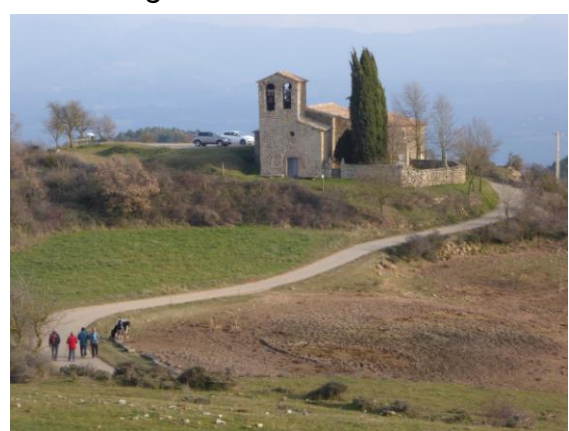
Sant Cugat de Gavadons