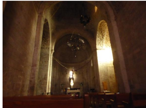
Església de Santa Maria