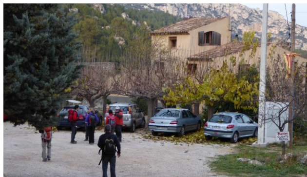
Refugi els Masets

vall de la Riba amb bones vistes del Puig Cabré i la serra de les Guixeres que coronarem demà. Creuem el GR7 que puja de la Riba i anem a veure la font i mas de Pasqual, els darrers punts d'interès abans de baixar al refugi els Masets on passarem la nit.