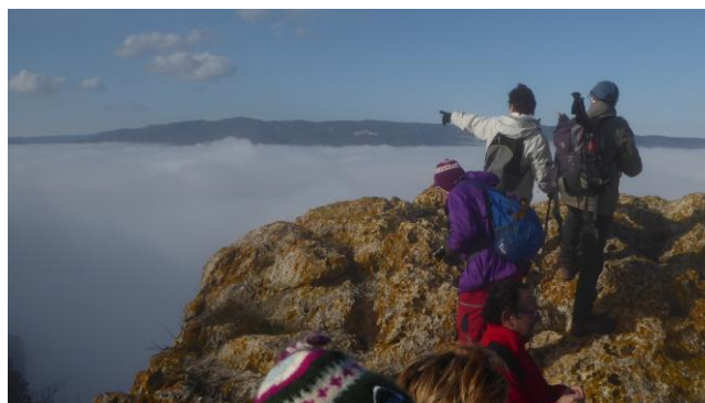
La boira ens dóna una treva

Abans d'arribar al cim, anem per un corriol a l'esquerra que baixa al coll de la Sivina, on per pista remuntem paral·lels a la carena de la serra. Sembla que la boira s'aixeca una mica i podem esmorzar al sol, al recer del vent glaçat. Al coll d'en Manel agafem l'estret corriol que s'enfila pel vessant meridional de la serra fins la carena i la gran roca que indica el punt més alt de la serra de les Guixeres.