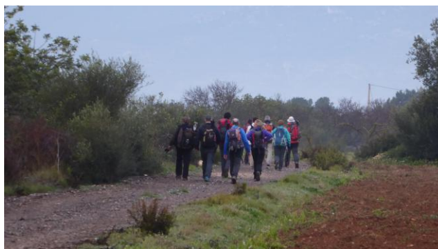
Entre camps de conreu