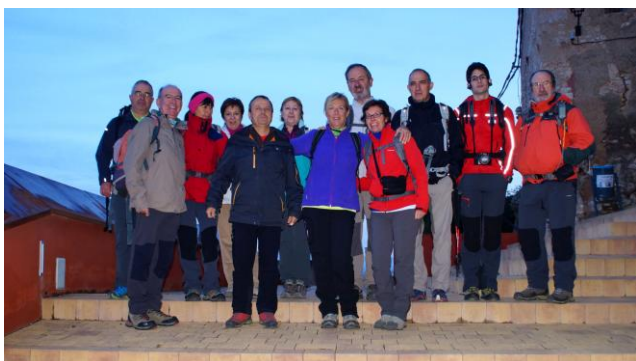
Sortida del Portal de Puigpelat

Itinerari dissabte: Puigpelat - GR® 172 – Alió - PR®-C 4 - El Camp d'Aviació - Valls - Granja Doldellops - Pont de Goi - Urb. Serradalt - Camí dels Muntanyans - Encreuament C-14 - Granja Vila - Mas de l'Esquerrer - Mas de Peüller - Mas de Toio - Mas de Besora - GR® 7 - Font de Pasqual - Refugi dels Masets. Km: 23 Hores reals: 8