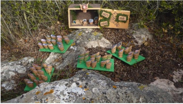
Un pessebre amb cares i molts 'pastorets'