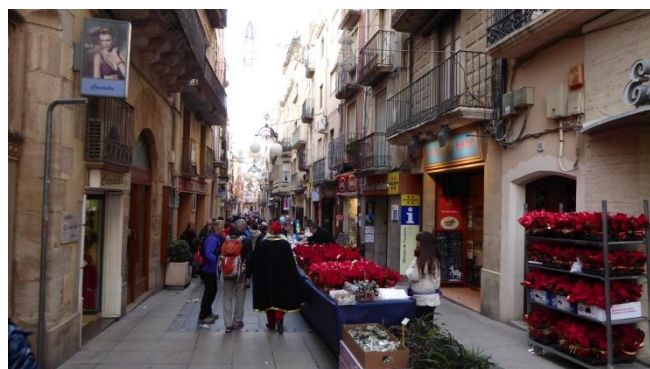
Mercat de Nadal a Valls