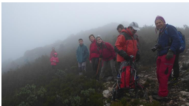
Boira en la pujada al Puig Cabré

La boira tancada ens rep de bon matí quan comencem a caminar. Sortim de la Riba i prenem el sender del grau del Coster de la Cansaladeta que puja fort al Puig Cabré. La fredor de la boira que ens envolta ens amaga la vista i un molest vent gelat ens castiga.