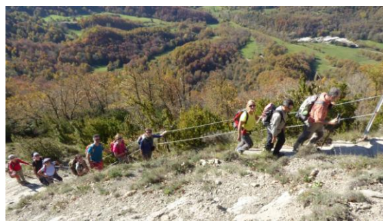
Escales a Cabrera

El sender puja entre bosc acolorit d’avellaners, faigs i roures, esplèndids en aquests dies clars de tardor, justament el que veníem a buscar, mentre trepitgem una catifa de fulles caigudes que dissimulen els contorns del camí. Al coll del Bram prenem les escales tallades a la roca que s’enfilen per l’esperó fins al punt més alt de la serra: primer al santuari de la Mare de Déu de Cabrera on fem una aturada per esmorzar i després fins el vèrtex geodèsic i la taula d’orientació que marca el cim del pic de Cabrera, de 1.308 m.