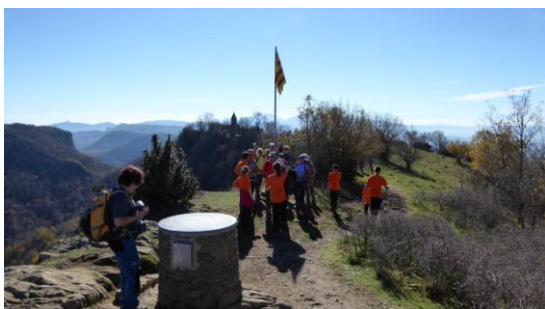
Pic de Cabrera

El sender puja entre bosc acolorit d’avellaners, faigs i roures, esplèndids en aquests dies clars de tardor, justament el que veníem a buscar, mentre trepitgem una catifa de fulles caigudes que dissimulen els contorns del camí. Al coll del Bram prenem les escales tallades a la roca que s’enfilen per l’esperó fins al punt més alt de la serra: primer al santuari de la Mare de Déu de Cabrera on fem una aturada per esmorzar i després fins el vèrtex geodèsic i la taula d’orientació que marca el cim del pic de Cabrera, de 1.308 m.