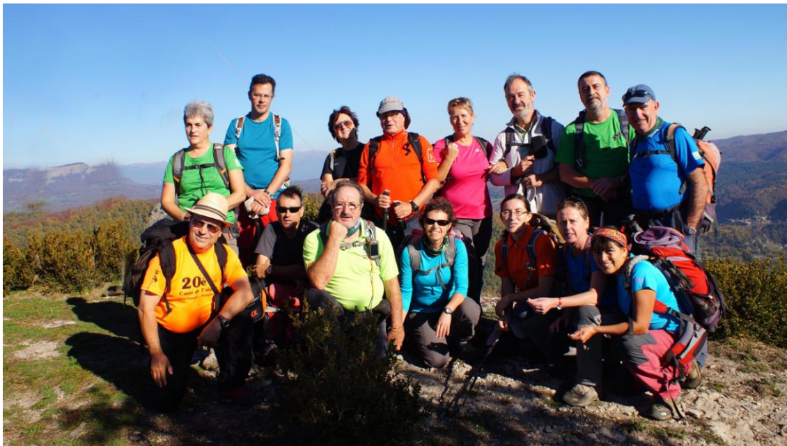
Al cingle del Pla Boixer

Susqueda i Sau i els turons de les Guillerries, amb el Montseny tancant l'horitzó. Per la casa rural de l'Avenc pugem al vèrtex geodèsic de Rocallarga (1.187 m) on esmorzem. Les incertes boires típiques del temps anticiclònic resten saturació als colors de l'ampli panorama. A partir d'aquí anem en direcció nord, pel pic de Cortils i el collet de Rajols fins trobar les pestes que baixem lentament entre una espessa fageda i els conreus fins les cases de Cantonigròs, on tanquem el cercle d'aquesta excursió.