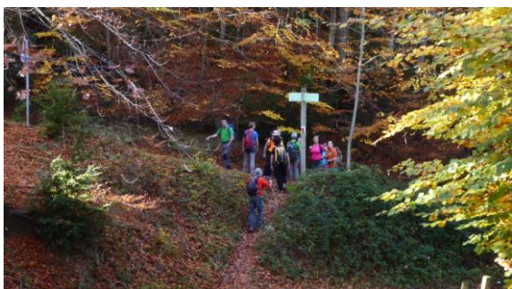
Pujant a Rajols

Sortim a \frac{3}{4} de 9 pel GR2 en direcció oest, pujada suau i sostinguda entre bosc fins la granja de Rajols. Aquí prenem la pista al sud que mena al cingle del Pla