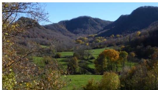
Tardor al Collsacabra