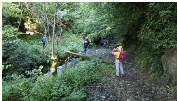
GR18.1 camí d'Ardanué

El dimecres 5 amb 18°C sortim pel GR18.1 per fer una variant més llarga de la ruta que passa per poblets desconeguts de la part baixa de la vall de Castanesa. Ardanué ens sorprèn amb la capella romànica, mentre que Neril ha patit la febre del totxo amb una urbanització abandonada. A Laspaúles, lloc famós per les bruixes, parem a esmorzar, hi passa la carretera i notem animació. Segueix una llarga baixada pel solitari barranc de la Paúl fins les bordes d'Añué on agafem el GR15 que puja fins Alins, encastat en la serra. Fa molta calor altra vegada, reposem i bevem. Un sífó considerable del camí baixa a creuar el riu Isàbena i torna a pujar fins l'Alt de Bonansa i el poble del mateix nom, on farem la darrera nit en ruta a l'allotjament rural Casa Lluís. Tant la gent jove com gran que hem trobat en aquests pobles d'administració aragonesa parlen habitualment en català i conserven la tradició de les Falles pirinenques. Avui hem fet 20 km en 8 hores i mitja.