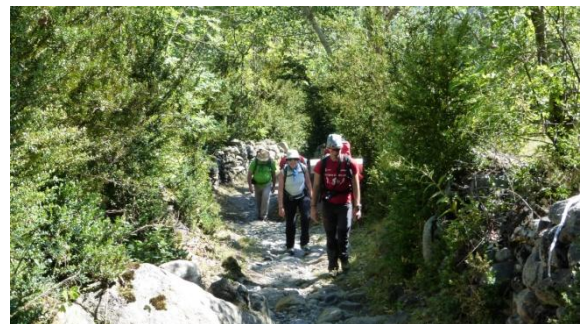
Pujada a Erill-la-vall

Abans de sopar visitem l'església romànica de Santa Eulàlia. A l'endemà sortim a 2/4 de 9 amb 17°C, remuntant en direcció oest el barranc de Basco, primer entre bosc i després sobre prats agostats per aquest estiu tan sec i calorós que portem, amb el sol a l'esquena i moltes mosques. Fem 800 m de desnivell de cop fins la collada de Basco (1.918m) i la seva font, on deixem enrere la vall de Boí. Passem una tanca, hi ha vaques i cavalls. Les balises grogues ens guien fent el flanqueig de la capçalera del barranc de la Muntanyeta de Barruera fins la darrera pujada al port de Gelada (2.069m) ampli escenari d'entrada a la vall de Barravés. Portem quatre hores de camí, ens recuperem de la suada i