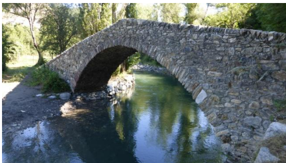
Pont romànic del Remei

El dissabte dia 1 d'agost a la tarda ens reunim els participants al Pont de Suert on comença aquesta ruta circular de 5 dies. A la oficina gestora ens proporcionen el llibre de ruta i el mapa. Tenim reservats tots els allotjaments en mitja pensió. El diumenge 2 sortim a les 9 del matí seguint les senyals del Camí de l'Aigua, que remunta els rius Noguera Ribagorçana i Noguera de Tor per la vall de Boí, caminem per la riba obaga entre bosc i la temperatura és agradable. Passem pel costat de l'ermita i el pont romànic del Remei, davant de Castelló de Tor, després el pantà de Llesp, deixant enrere Còll i pel pont de Cardet canviem de riba. El pantà de Cardet forma un veritable llac amb Barruera al fons, on entrem per la zona del càmping. La temperatura ja és de 30°C mentre descansam a l'ombra i mengem. El darrer tram d'una hora segueix el riu i acaba amb la pujada final fins Erill-la-vall, on entrem tocades les cinc de la tarda. Hem fet 19 km i 696 metres de desnivell en 8,15 hores totals.