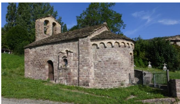
Capella romànica d'Ardanué

El dimecres 5 amb 18°C sortim pel GR18.1 per fer una variant més llarga de la ruta que passa per poblets desconeguts de la part baixa de la vall de Castanesa. Ardanué ens sorprèn amb la capella romànica, mentre que Neril ha patit la febre del totxo amb una urbanització abandonada. A Laspaúles, lloc famós per les bruixes, parem a esmorzar, hi passa la carretera i notem animació. Segueix una llarga baixada pel solitari barranc de la Paúl fins les bordes d'Añué on agafem el GR15 que puja fins Alins, encastat en la serra. Fa molta calor altra vegada, reposem i bevem. Un sífó considerable del camí baixa a creuar el riu Isàbena i torna a pujar fins l'Alt de Bonansa i el poble del mateix nom, on farem la darrera nit en ruta a l'allotjament rural Casa Lluís. Tant la gent jove com gran que hem trobat en aquests pobles d'administració aragonesa parlen habitualment en català i conserven la tradició de les Falles pirinenques. Avui hem fet 20 km en 8 hores i mitja.