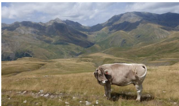
Vall de Castanesa

El dimarts 4, sota amenaça de pluja, encarem la llarga pujada que remunta la vall de Llauset, primer pel GR11 i després pel GR18, anem per pista còmoda entre bordes. A la font del Bisbe portem ja més de tres hores i fem un mos. Avui fa més fresca, 20°C, encara que el cel es va obrint. L'ampli coll de Salines (2.133m) és el darrer esforç per un GR18 amb poques marques. L'ampla capçalera de la desconeguda vall de Castanesa s'obre davant nostre: a l'oest, la Tuca de Castanesa (2.861m) i la Tuca de Basibé delimiten el coll de Basibé, frontera amb l'estació d'esquí de Cerler que diuen té previst colonitzar aquesta vall. Unes balises esparses ens guien sense camí en una llarga baixada entre prats pel barranc de Pletillet. Al fons es veuen algunes bordes però tot té un