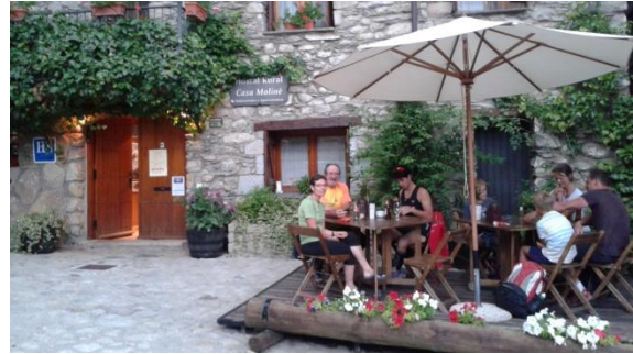
Al poble d'Aneto

temperatura augmenta, arribem a les 3 de la tarda a Senet amb 30°C i els carrers deserts. Per carretera travessem la Noguera Ribagorçana, frontera provincial imposada al 1833 que va tallar pel mig una comarca amb una llengua i cultura comunes. Aneto és el primer poble de l'Aragó, on arribem a les 5 de la tarda. Una parella de Montcada fan la ruta com nosaltres, ens expliquem aventures. Durant la nit caurà una forta tempesta.