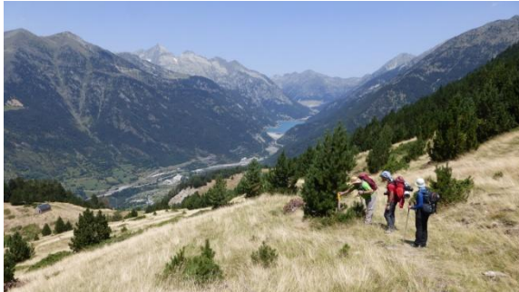
Vall de Barravés

mengem, estem a 25°C. Durant la baixada podem gaudir d'una perspectiva inèdita d'aquesta vall que sempre havíem travessat per carretera cap el túnel de Vielha, amb els cims de Vallhibierna i Russell a dalt i el pantà de Baserca al fons. Anem per sender i pista, les marques canvien de grogues a blaves, la