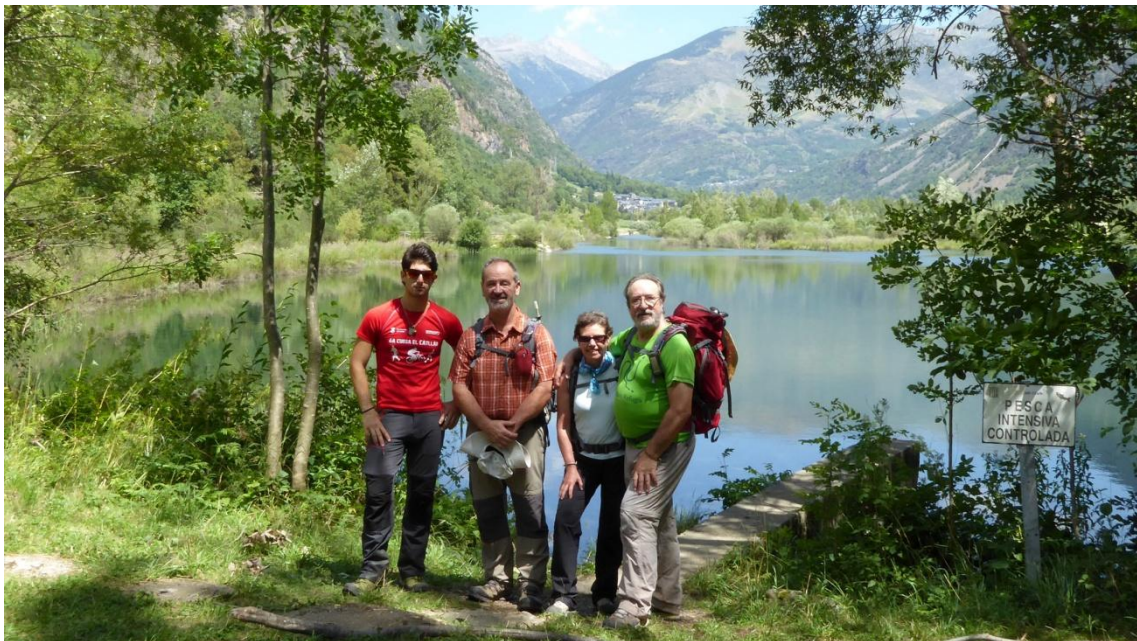
Pantà de Cardet i Barruera al fons (Vall de Boí)

El dijous 6 d'agost fem la darrera etapa, un curt recorregut en descens cap el Pont de Suert, seguint el GR15, ample i ben marcat, primer entre boscos d'avellaners, faigs i pins i després pes pastures verdes amb ovelles. Passat el poblet de Cirés agafem el vessant solà de la vall i patim la calor del sol inclement mentre baixem fins el Pont, final de la ruta. Hem quedat molt contents d'aquest itinerari que ens ha descobert visions insòlites de dues valls conegudes, Boí i Barravés, a més del descobriment d'una solitària vall de Castanesa que ens ha deixat un record molt agradable. La ruta està ben organitzada, els allotjaments són còmodes, sols la calor excessiva ens ha sobrat. Al Pont de Suert trobem de ple la festa major d'estiu i descobrim el seu sorprenent nucli antic. Més detalls a: www.ruta3valls.com