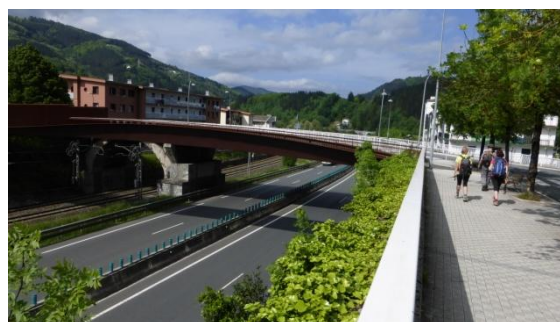
Arribada a Ordizia

La sisena i darrera etapa és la més curta. Coincidirem avui durant tot el recorregut amb les marques de la variant nord de Camí de Sant Jaume. Deixem enrere el brogit urbà de les grans vies de comunicació que travessen Beasain per guanyar una altra vegada les alçades i la calma de la zona rural. Mirant enrere tenim una bona vista de la serra d'Aralar i l'aguda piràmide del pic Txindoki, de 1.346 metres. Alguns núvols tapen el sol, però el temps ens afavoreix. Si mirem endavant, veiem una altra vegada el perfil rocallós de la serra d'Aizkorri que vam pujar fa quatre dies. Anem per camí asfaltat,