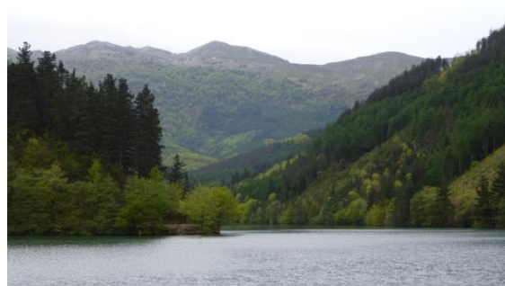
Embassament de Barrendiola

Diumenge 3 entrem al Parc Natural Aizkorri-Aratz i a partir de l'embassament de Barrendiola comencem la llarga pujada a la serra d'Aizkorri, la més alta del territori guipuscoà. Avets, roures i faigs d'un verd primaveral configuren un bosc continu i silenciós. Des de dalt del coll, a 1.199 metres, s'albira un ampli