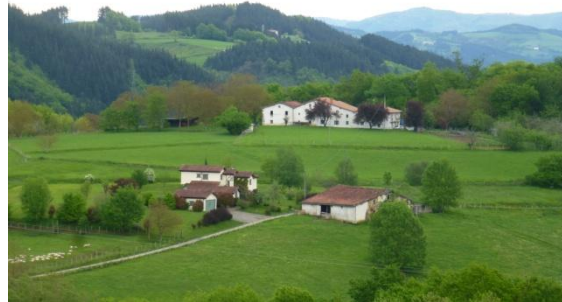
Paisatge rural del Goierri