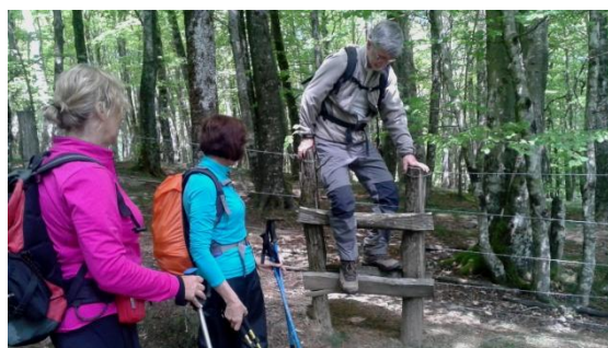
El camí salta les tanques ramaderes