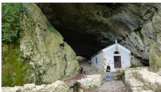
Túnel de San Adrián

La quarta etapa comença sota una pluja feble que obliga a traure la capelina; per sort només es manté durant una hora. La primera pujada ens porta a la línia de bosc, que es envoltarà durant tota la jornada mentre resseguim la carena divisòria d'aigües i frontera administrativa entre Guipúscoa i Navarra. La boira fantasmal ens acompanyarà durant unes hores, fins que el sol guanya