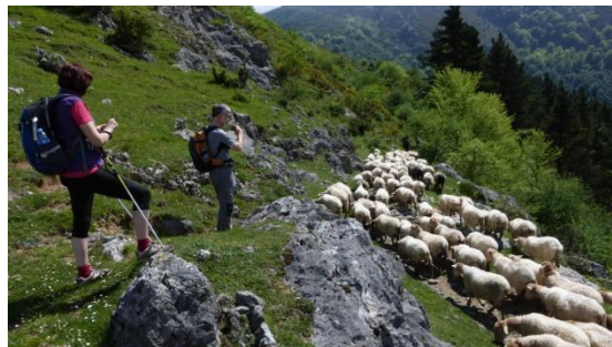
Un ramat transhumant

ramader on trobem un ramat d'ovelles que puja per començar la temporada de pastures a dalt de la serra. El manteniment dels models de vida tradicional i fer-los rendibles i compatibles amb les activitats complementaris com el turisme rural és un propòsit que engresca els habitants de la zona. Arribats al fons de les valls, seguim el curs del riu Aiestaran vora de l'antiga central elèctrica d'Arkaka. A partir de la població de Zaldibia encarem la darrera pujada. Avui serà l'etapa més llarga, farem més de 25 km en més de 9 hores i acabarem al tràfec urbà d'Ordizia. La inesperada propina seran tres kilòmetres més pels carrers, tot seguint el riu Oria, fins l'industrial Beasain, on tenim l'hotel.