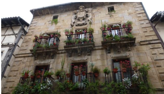
Casa blasonada a Segura

Aquesta ruta circular de 6 dies permet recórrer la part interior de la província basca de Guipúscoa, una zona rural poc coneguda, la major part a la comarca del Goierri, travessant dos parcs naturals. Nosaltres vam contractar via web el paquet sencer de mitja pensió amb transport d'equipatges inclòs. El divendres dia 1 de maig ens apleguem, a 5 hores d'autopista de casa nostra, al poble emmurallat de Segura, fundat al segle XII, amb boniques cases senyorials.