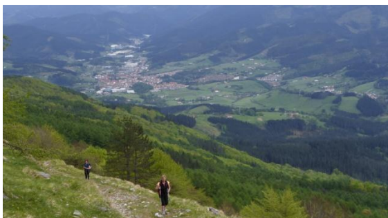
Pujant la serra d'Aizkorri

paisatge de boscos i poblacions com Oñati i Legazpia. El vent bufa fred i el cel s'enfosqueix. L'etapa acaba al famós santuari d'Arantzazu. Al vespre plourà.