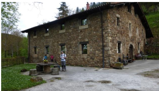
Casa rural Pastain a Mirandaola

El dissabte 2 iniciem la caminada seguint els senyals blancs i vermells del GR283 i els nombrosos pals indicadors. Pugem lleugerament per un paisatge verd de prats, pastures amb ovelles i poblament dispers fins el poble de Zerain, i seguim per l'antiga zona minera de Mutiloa, avui museïtzada, que puja fort. A dalt fem una aturada per menjar els entrepans que ens han preparat. A partir del nucli d'Aztiria anem baixant travessant una humida fageda, per un camí mig enfangat fins Mutiloa, fi d'etapa. Ens esperen a la casa rural Pastain, bonic edifici tradicional on Juanita, la mestressa, ens dóna conversa i a la nit ens farà el sopar. Hem fet 13 km en 6 hores tranquil·les amb 670 metres de desnivell.