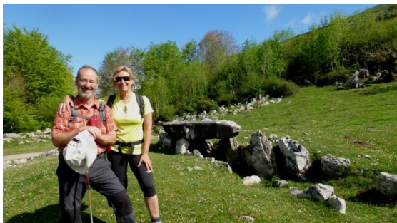
Dolmen de Jentillari

de nou. Alguns trams del camí es troben enfangats. Una llarga baixada acaba al simpàtic alberg de Lizarrusti. Hem fet 15 km a pas relaxat. La cinquena etapa travessa íntegrament de sud a nord el Parc Natural d'Aralar. L'habitual pujada de cada matí ens porta a l'embassament de Lareo i acaba a les assolellades pastures d'alçada. Veiem ramats de vaques i cavalls, ens fotografiem amb un dolmen catalogat i ben conservat. Aquesta zona és rica en megàlits. El vessant nord de la serra és molt escarpat i l'abrupta baixada es fa per un ampli sender