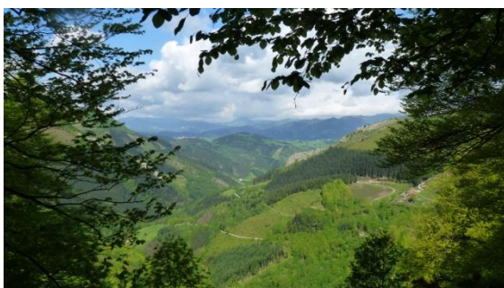
Baixant la serra d'Aralar

ramader on trobem un ramat d'ovelles que puja per començar la temporada de pastures a dalt de la serra. El manteniment dels models de vida tradicional i fer-los rendibles i compatibles amb les activitats complementaris com el turisme rural és un propòsit que engresca els habitants de la zona. Arribats al fons de les valls, seguim el curs del riu Aiestaran vora de l'antiga central elèctrica d'Arkaka. A partir de la població de Zaldibia encarem la darrera pujada. Avui serà l'etapa més llarga, farem més de 25 km en més de 9 hores i acabarem al tràfec urbà d'Ordizia. La inesperada propina seran tres kilòmetres més pels carrers, tot seguint el riu Oria, fins l'industrial Beasain, on tenim l'hotel.