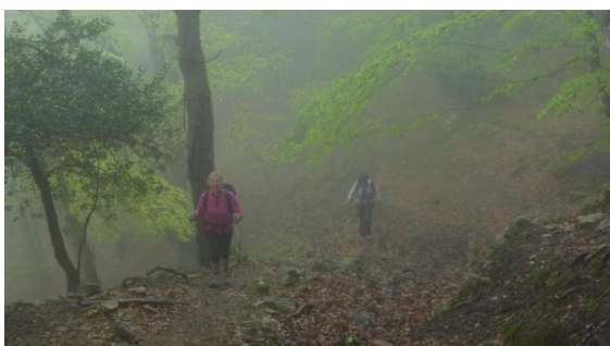
Pluja i boira al bosc humit

La quarta etapa comença sota una pluja feble que obliga a traure la capelina; per sort només es manté durant una hora. La primera pujada ens porta a la línia de bosc, que es envoltarà durant tota la jornada mentre resseguim la carena divisòria d'aigües i frontera administrativa entre Guipúscoa i Navarra. La boira fantasmal ens acompanyarà durant unes hores, fins que el sol guanya